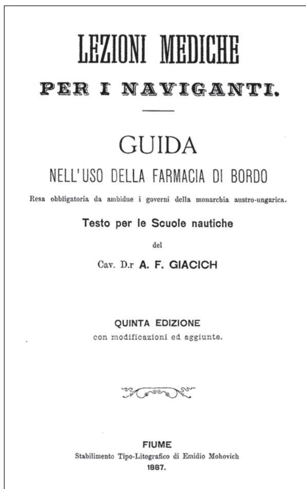
Slika 3. Naslovnica priručnika Lezioni mediche per i naviganti