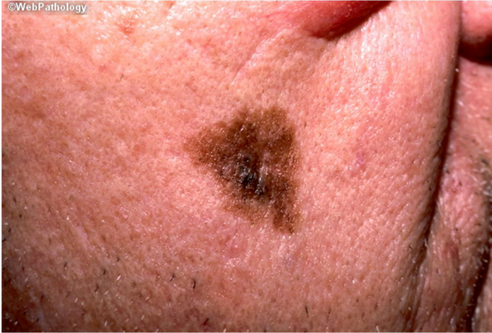
Slika 3. Lentigo maligna melanom