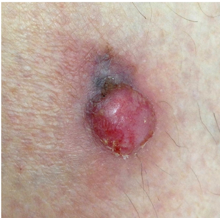
Slika 2. Nodularni melanom