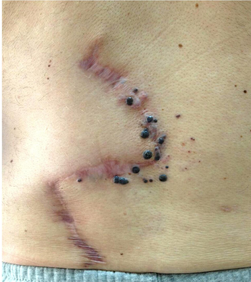
Slika 6. Regionalne metastaze melanoma u području postoperativnog ožiljka