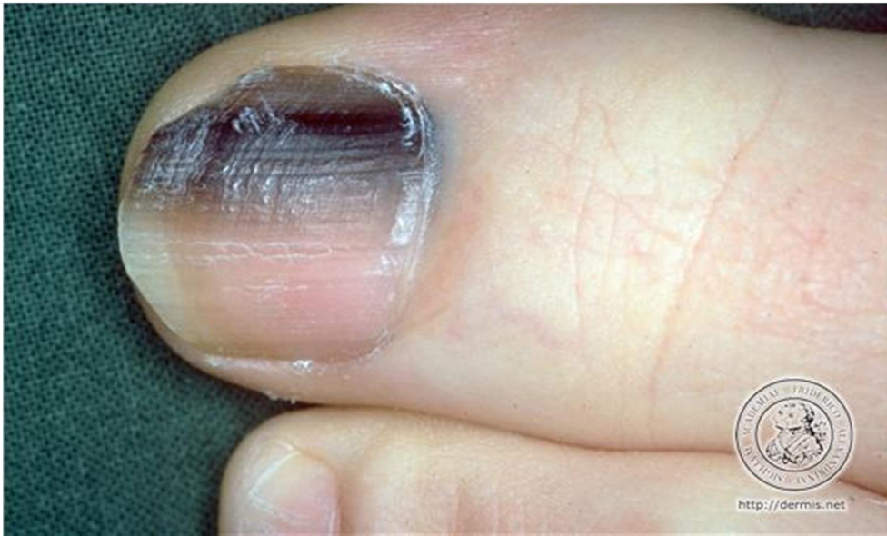
Slika 4. Subungvalni melanom