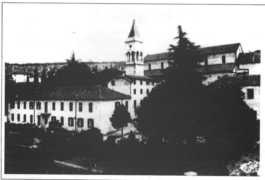
SLIKA 5. Crkva i samostan Sv. Franje u Imotskom

tradicionalnih recepata i naputaka uvijek valja polaziti upravo s tih polazišta. Kao osnova za pripremanje ljekovitih pripravaka upotrebljavaju se u prvom redu dostupna sredstva iz domaćinstva ili neposredne okolice. Od živežnih namirnica to su mlijeko, med, ocat, brašno, kruh, ječam, sol. Važno mjesto pripada crnu i bijelu vinu te duhanu. To su uglavnom adjuvanti, služe kao otapala, za popravljivanje okusa i sl. Prema opsegu najveći dio etnoterapije temelji se na fitoterapiji. U pravilu koriste se biljke ubrane u blizini obitavališta, ili uzgojene. Veći dio biljnih lijekova utemeljen je iskustveno. Koriste se