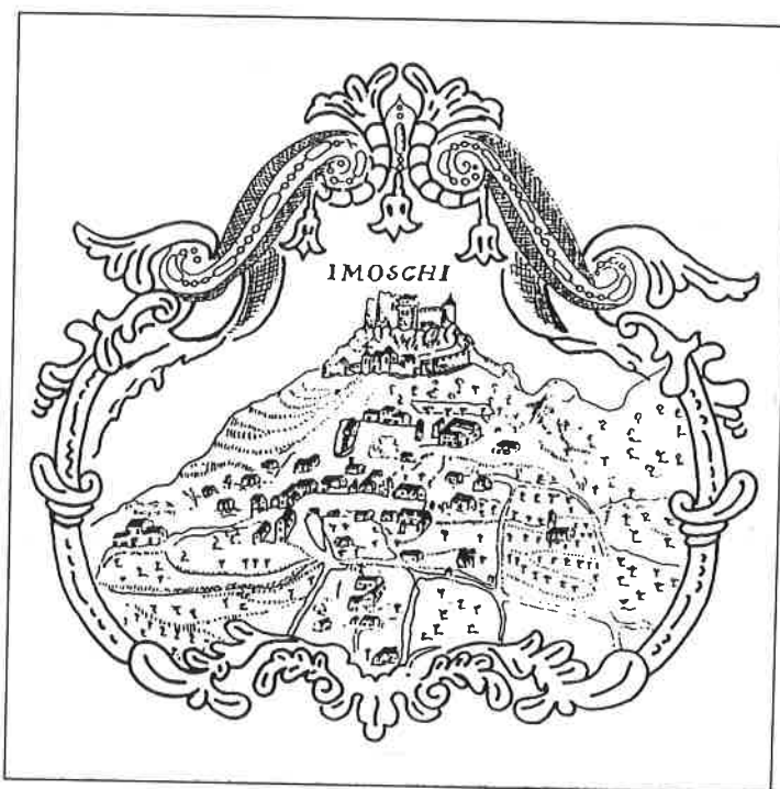
SLIKA 1. Imotski u 18. stoljeću prema slici P. Corirra u Katastiku Imotskoga iz 1774.

Prisutnost franjevacu u Imotskoj krajini odrazila se u svim oblicima života, pa i u zdravstvenu djelovanju. Dragocjen dokaz o tome je i nekoliko ljekaruša nastalih tu, a vezanih uz imena pojedinih franjevacu. Za ovu priliku