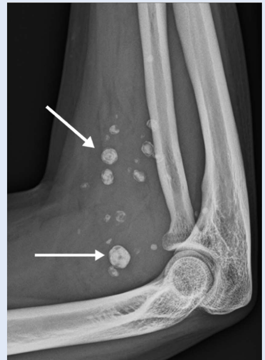
Slika 2. Fleboliti u području lakatnog zgloba desne ruke

za 10° i prstiju desne ruke. Nema vidljivih promjena na koži (slika 1) te se upućuje na ehotomografiju mišića desne podlaktice. U području m.