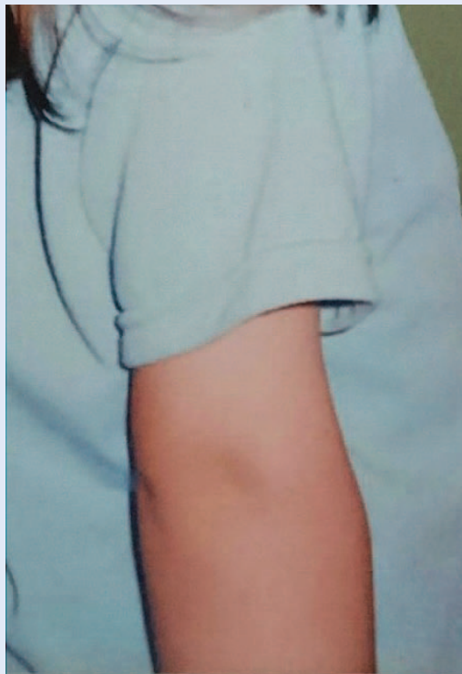
Slika 1. Otečena desna podlaktica

za 10° i prstiju desne ruke. Nema vidljivih promjena na koži (slika 1) te se upućuje na ehotomografiju mišića desne podlaktice. U području m.