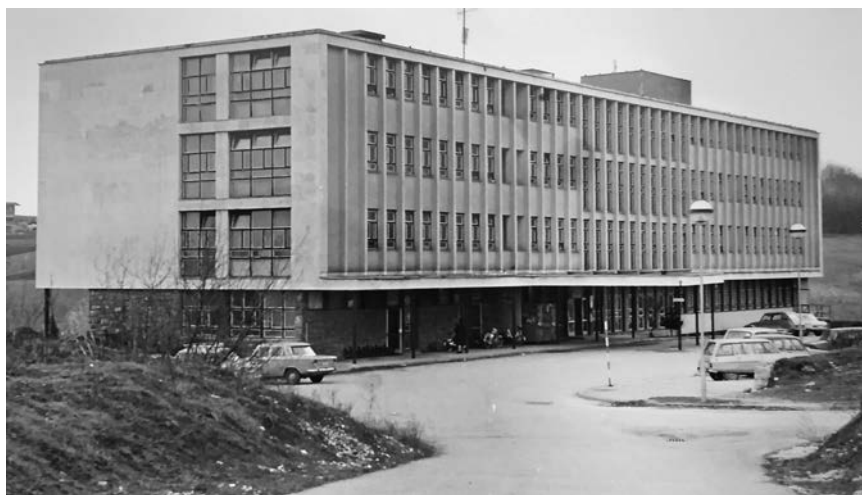
Slika 3. Prva etapa Medicinskog centra Karlovac.

bolnice Karlovac, koja je zbog nedostatnih materijalnih sredstava do 1967. zaustavljena, a potom nastavljena u sljedeće dvije godine. Svečano otvorenje prvog objekta Medicinskog centra Karlovac upriličeno je u povodu tadašnjeg „praznika komune Karlovac“ 17. studenoga 1969., a novosnovani Odjel za neuropsihijatriju započeo je s radom nekoliko dana prije – 3. studenoga 1969. 21 Od ukupnog kapaciteta 96 kreveta, veći dio namijenjen je Odjelu za plućne bolesti, a 32 kreveta Odjelu za neuropsihijatriju (slika 3.). Za izgradnju objekta utrošeno je osam milijuna novih dinara, od čega je dio činio samodoprinos građana, a dvanaest tisuća dolara doniralo je iseljeništvo Hrvatske bratske zajednice iz Sjedinjenih Američkih Država. 22,23 Osnivanjem Odjela i smještajem u novoizrađenom objektu započinje i drugo razdoblje razvoja psihijatrijske službe u Karlovcu. Time se omogućava sustavno, sveobuhvatno i suvremeno zbrinjavanje osoba sa psihičkim tegobama u okviru sekundarne zdravstvene zaštite te platforma za daljnji razvoj koji je uslijedio organizacijom polikliničke i dnevnobolničke djelatnosti. Osobito je zanimljiv opis djelatnosti Službe za živčane i duševne bolesti u Statutu Medicinskog centra Karlovac iz 1970., pri čemu se izdvaja „specijalistička služba u specijalističkoj ambulanti i stanu bolesnika“, kao i „konzilijarni pregled bolesnika u kućnom liječenju“, čime shvaćanje razvoja koncepta psihijatrije u zajednici na ovim prostorima dobiva dodatne dimenzije. 24