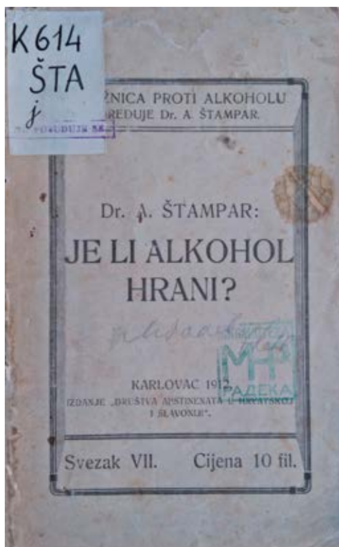
Slika 2. Knjižica proti alkoholu ; Dr. A. Štampar: Je li alkohol hrani?, Karlovac, 1912.