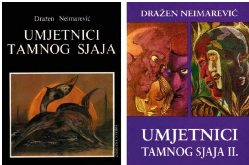
Slika 5. Umjetnici tamnog sjaja.