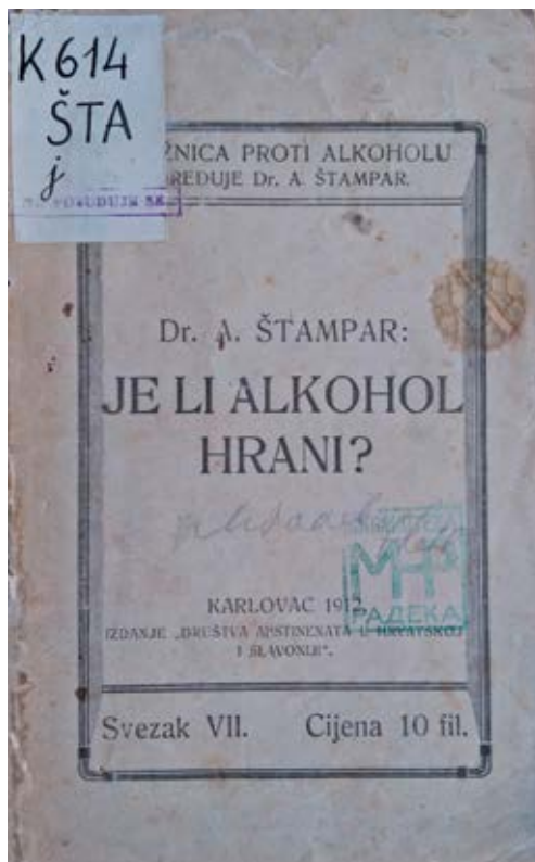
Slika 2. Knjižica proti alkoholu ; Dr. A. Štampar: Je li alkohol hrani? , Karlovac, 1912.

Specijaliziravši neuropsihijatriju 1964. dr. Edo Lukinić radi u ambulanti u Šebetićevoj ulici, odakle nakon tri godine odlazi u Klimatsko liječilište Topusko, da bi se 1970. vratio u Karlovac nastavivši neuropsihijatrijski rad u Medicinskom centru. Radilo se o eruditu širokoga općeg obrazovanja i kulture, posvećenom pacijentima i omiljenom među kolegama. Cvitanović će za njega istaknuti da je „primjeran i nedostizhan u čitkom krasopisanju konzilijarnih nalaza“. 20