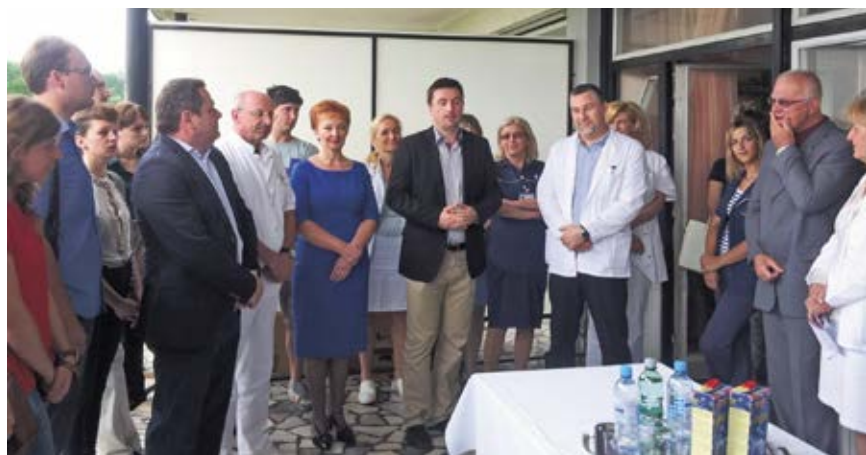
Slika 8. Svečanost otvorenja prve ambulante za liječenje seksualnih poremećaja u Hrvatskoj, 23. lipnja 2014.

Britaniji te organizacijom sveobuhvatnoga ambulantnog pristupa omogućuje pacijentima farmakološki i psihosocioterapijski interdisciplinarni pristup. 37