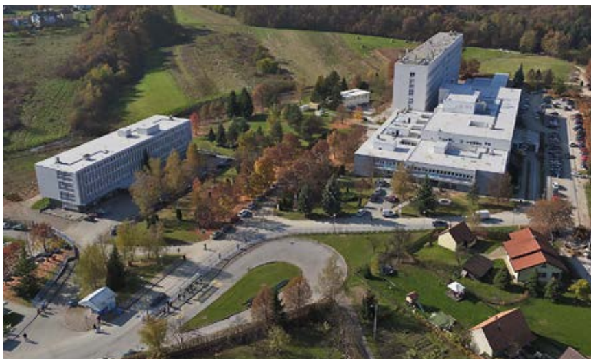
Slika 9. Bolnica po završenoj energetskej obnovi 2016. Lijevo: južni objekt Bolnice u kojem je smješten Odjel za psihijatriju od osnivanja 1969.

2018. rekonstruirane su, uređene i opremljene za rad obje dnevne bolnice. S drugog kata u prizemlje Dnevna bolnica za psihoterapiju premještena je uz Dnevnu bolnicu za alkoholologiju. 38 Više od petsto četvornih metara novouređenog prostora služi kvalitetnijem i ugodnijem liječenju osoba sa psihičkim teškoćama iz spektra alkoholizma, anksioznosti, depresije i posttraumatskoga stresnog poremećaja. Pritom su renovirani i prostori za paralelni rad psihijatrijskih ambulanti. U jesen 2016. na prirodnoj padini južno od objekta Švarča I, sasvim uz Odjel i dnevne bolnice započela je izgradnja Terapijskog parka Opće bolnice Karlovac. Na taj način moći će se provoditi sveobuhvatnije liječenje u obliku grupne psihoterapije, individualnog pristupa, terapijskih zajednica i ostalih terapijskih modela u posebno ambijetalno osmišljenom prostoru. S osnovnom vizijom parka kao integrativnog dijela terapijskog procesa isprepleće se funkcija prirode kao sredstva terapije te djelovanje okoliša na čovjeka preko svih njegovih osjetila, uz oblikovanje prostora koji djeluje umirujuće stvarajući ozračje potrebno za razvoj pojedinca ili grupe. Kao dodatna vrijednost parka bit će moguće održavanje različitih društveno-kulturnih i sportsko-rekreativnih aktivnosti.