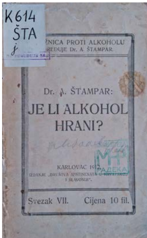
Slika 2. Knjižica proti alkoholu ; Dr. A. Štampar: Je li alkohol hrani? , Karlovac, 1912.

Specijaliziravši neuropsihijatriju 1964. dr. Edo Lukinić radi u ambulanti u Šebetićevoj ulici, odakle nakon tri godine odlazi u Klimatsko liječilište Topusko, da bi se 1970. vratio u Karlovac nastavivši neuropsihijatrijski rad u Medicinskom centru. Radilo se o eruditu širokoga općeg obrazovanja i kulture, posvećenom pacijentima i omiljenom među kolegama. Cvitanović će za njega istaknuti da je „primjeran i nedostizhan u čitkom krasopisanju konzilijarnih nalaza“. 20