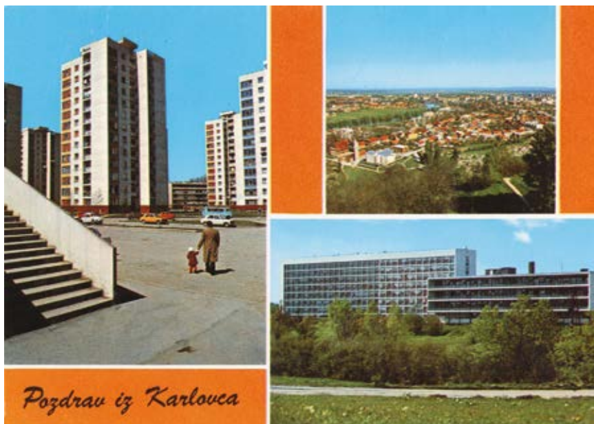
Slika 6. Pozdrav iz Karlovca s motivom Opće bolnice Karlovac.