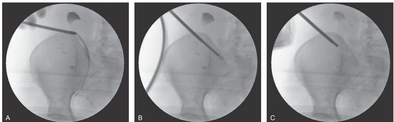
Slika 2. Miniperkutana nefrolitotripsija: A) dilatacija pristupnog trakta s jednim dilatorom preko žice vodilice, B) postavljen omotač nefroskopa i sam nefroskop ispred kojega se nalazi kamenac, C) snimka na kraju operacije kojom se potvrđuje da je kamenac destruiran, a njegovi fragmenti odstranjeni

U jednoga transplantiranog bolesnika nije bilo moguće retrogradnim putem postaviti ureteralnu sondu. Kod njega je zbog stenozе ureterovezikalne anastomoze prethodno postavljena perkutana nefrostomija. Također jedino je kod njega operacija učinjena u supinacijskom položaju. Prethodno