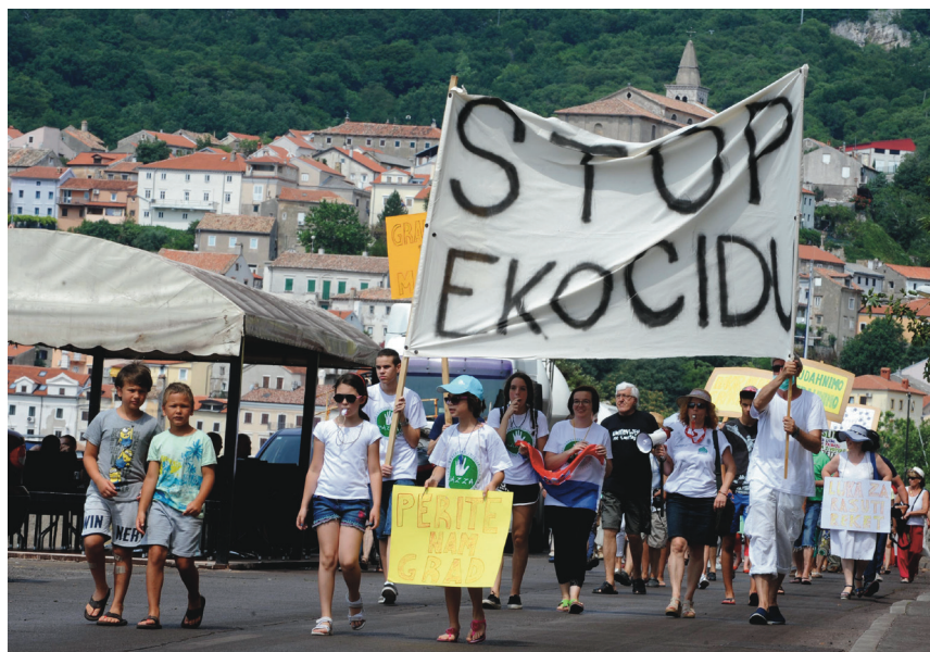
Prilog 5. Prosvjed u Bakru protiv zagađenja iz bakarskog terminala za rasute terete, 24. lipnja 2017. godine

No, pri intervjuima je naglašena svijest da zatvaranjem koksare nisu nestali svi onečišćivači u blizini Bakra. Među njima se posebno ističe terminal za rasute terete, gdje se zbog prekrcaja rudače i neadekvatnog zbrinjavanja viška onečišćuje more. U zraku je i dalje velika koncentracija čestica prašine, posebice za vjetrovitih dana, što stvara crni talog na objektima i zahtijeva konstantno čišćenje kućanstva, kako je pojasnila jedna od sugovornica: “Ja ću danas zapolne i jutre provest va čišćenju, aš je čera bila bura.” Godine 2017. Građanska inicijativa Za Bakarski zaljev i zaleđe BazZa organizirala je prosvjede kako bi, porukama poput “Stop ekocidu”, “Grad na moru bez mora”, “Imamo pravo na čisti zrak”, “Za čista pluća grada Bakra” i sl., uputila na zagađenje iz Luke Bakar (Gašpert 2017). Osim onečišćenja koje gradu donosi terminal za rasute terete, u zraku se i dalje može osjetiti neugodan vonj koji podsjeća na miris sumpora, a koji dolazi iz obližnje rafinerije Urinj: “[K]ad se koksara zaprla, vavek su povedeli da smrdi od koksare, sad zna preko noći Urinj smrdet da se ne more živet.”