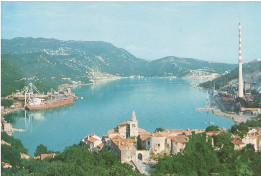
Prilog 3. Bakarski zaljev s gradom Bakrom, lukom i terminalom za rasuti teret (lijevo) i koksarom (desno), oko 1980. godine (Arhiva Turističke zajednice Grada Bakra)

Većina je industrijskih objekata srušena odmah po zatvaranju koksare, dok je dimnjak srušen 2005. godine, tijekom šestomjesečne intervencije (Radović 2005). Posljednji su objekti predviđeni za rušenje uklonjeni 2010. godine, kada je ujedno provedena sanacija platoa na kojem se nalazio kemijski pogon koksare. 3 No, iako zatvorena, bakarska koksara i dalje predstavlja djelatan čimbenik u rekreiranju lokalnih identiteta, u narativizaciji i problematizaciji gradske prošlosti i sadašnjosti te zamišljanju postindustrijskih budućnosti. Pritom u prvi plan dolaze lokalne predodžbe o onečišćenju, shvaćene u užem smislu rizika i štete počinjene po okoliš i zdravlje stanovništva, ali i u širem značenju stigmatizacije i društvene kontaminacije čitave zajednice opasnim onečišćujućim faktorom (Douglas 1984: 3). Upravo suvremene predodžbe i naracije o ekološkim i zdravstvenim učincima koksare, njezinu uplivu na način života stanovništva te njezinoj ulozi u urbanoj simboličkoj geografiji točke su analize u nastavku rada.