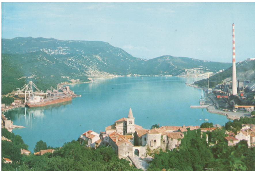
Prilog 3. Bakarski zaljev s gradom Bakrom, lukom i terminalom za rasuti teret (lijevo) i koksarom (desno), oko 1980. godine

Većina je industrijskih objekata srušena odmah po zatvaranju koksare, dok je dimnjak srušen 2005. godine, tijekom šestomjesečne intervencije (Radović 2005). Posljednji su objekti predviđeni za rušenje uklonjeni 2010. godine, kada je ujedno provedena sanacija platoa na kojem se nalazio kemijski pogon koksare. 3 No, iako zatvorena, bakarska koksara i dalje predstavlja djelatan čimbenik u rekreiranju lokalnih identiteta, u narativizaciji i problematizaciji gradske prošlosti i sadašnjosti te zamišljanju postindustrijskih budućnosti. Pritom u prvi plan dolaze lokalne predodžbe o onečišćenju, shvaćene u užem smislu rizika i štete počinjene po okoliš i zdravlje stanovništva, ali i u širem značenju stigmatizacije i društvene kontaminacije čitave zajednice opasnim onečišćujućim faktorom (Douglas 1984: 3). Upravo suvremene predodžbe i naracije o ekološkim i zdravstvenim učincima koksare, njezinu uplivu na način života stanovništva te njezinoj ulozi u urbanoj simboličkoj geografiji točke su analize u nastavku rada.