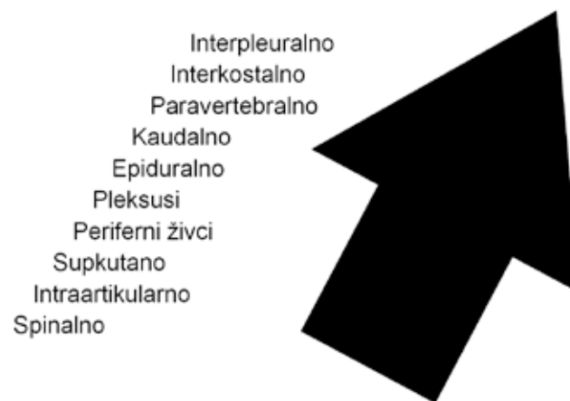
Slika 3. Poredak tjelesnih prostora prema mogućnosti brzine apsorpcije lokalnog anestetika. Spinalni prostor ima najmanju mogućnost apsorpcije, dok interpleuralni prostor ima najveću.

Prisutnost lokalnog anestetika u krvi rezultat je tkivne apsorpcije LA iz područja gdje je apliciran. Istraživanja su pokazala kako neki prostori u tijelu imaju veću, odnosno bržu mogućnost apsorpcije lokalnog anestetika u odnosu na druge (14) (Slika 3.).