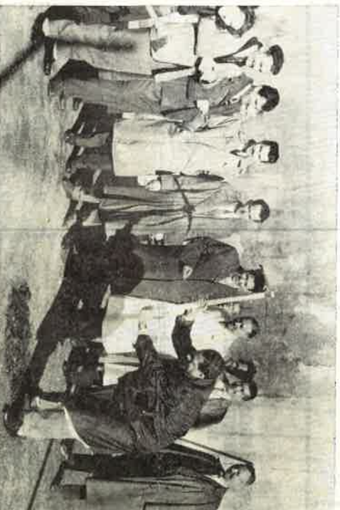
Svečano otvaranje radova za gradnju Patološko-anatomskog instituta Medicinskog fakulteta u Rijeci, 23. 11. 1959.

Upravo ovih dana, kada se ponovno, sesnaestit put, pune predavazantice Fakulteta kvantitetnim mladim ljudima, nismo u sumnji da će izrasti još jedna generacija mladih liječnika, sposobnih stručnjaka, okrenutih prema konkretnim problemima zdravstvene službe.