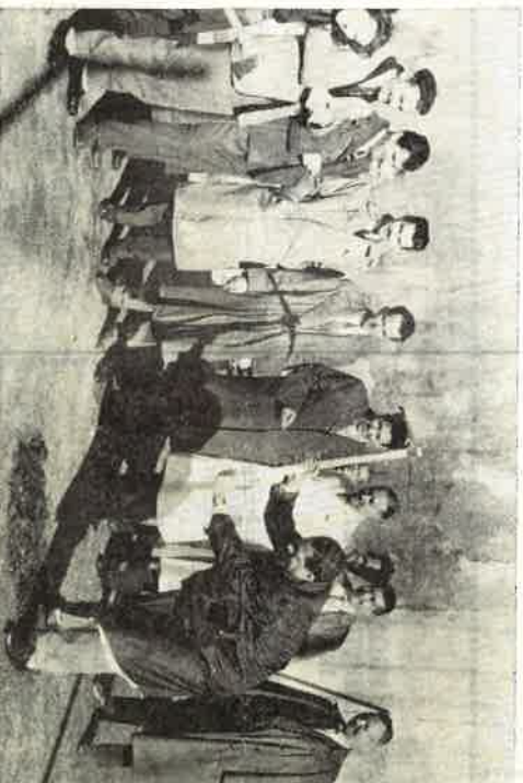
Svečano otvaranje radova za gradnju Patološko-anatomskeg instituta Medicinskog fakulteta u Rijeci, 23. 11. 1959.

Upravo ovih dana, kada se ponovno, sesnaestit put, pune predavazantice Fakulteta kvantitetnim mladim ljudima, nismo u sumnji da će izrasti još jedna generacija mladih liječnika, sposobnih stručnjaka, okrenutih prema konkretnim problemima zdravstvene službe.