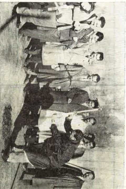
Svečano otvaranje radova za gradnju Patološko-anatomskeg Instituta Medicinskog fakulteta u Rijeci, 23. 11. 1959.

Upravo ovih dana, kada se ponovno, sesnaestit put, pune predavazantice Fakulteta kvalitetnim mladim ljudima, nismo u sumnji da će izrasti još jedna generacija mladih liječnika, sposobnih stručnjaka, okrenutih prema konkretnim problemima zdravstvene službe.