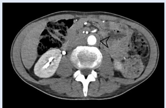
Slika 2. Aksijalni CT presjek kroz abdomen nakon intravenske aplikacije jednog kontrastnog sredstva pokazuje patološki mekotkivni supstrat infrarenalnog dijela aorte (označeno crnom strelicom) u sklopu aortitisa.

ANA (antinuklearna antitijela), ANCA (antineutrofilna citoplazmatska antitijela), ENA (ekstraktibilni nuklearni antigen) i ds-DNA protutijela bila su negativna. MR desne orbite pokazao je proširenje gornje desne oftalmične vene kao posljedicu zadebljanja dure te suženje gornje orbitalne fisure. CT aortografija prikazala je patološki mekotkivni supstrat oko infrarenalnog dijela aorte, koji je ukazivao na aortitis (slika 2). Sve navedeno uklapalo se u dijagnozu bolesti povezane s imunoglo-