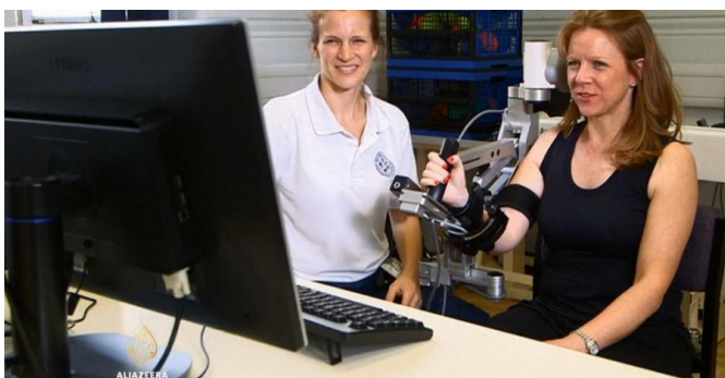
Slika 2: http://balkans.aljazeera.net/vijesti/roboti-pomazu-pacijentima-od-mozdanog-udara

U novije vrijeme sustavi asistirani računalom pokazuju obećavajuće rezultate za testiranje i stimuliranje mozga. Sustavi su jednostavni za korištenje, potrebno je poznavati osnovni rad na računalu. Pomoću robota koji je prilagođen ekstremitetu omogućava se pokret. Ovisno o stupnju oštećenja robot je prilagođen da pomaže u pokretu. Na ekranu se prikazuju točke koje se kreću u određenim smjerovima. Pacijent ih treba mišem ciljati i kliknuti na njih, pacijenta treba poticati da klika točno, prema njegovom napretku mijenja se struktura i kompleksnost zadatka (38, 39).