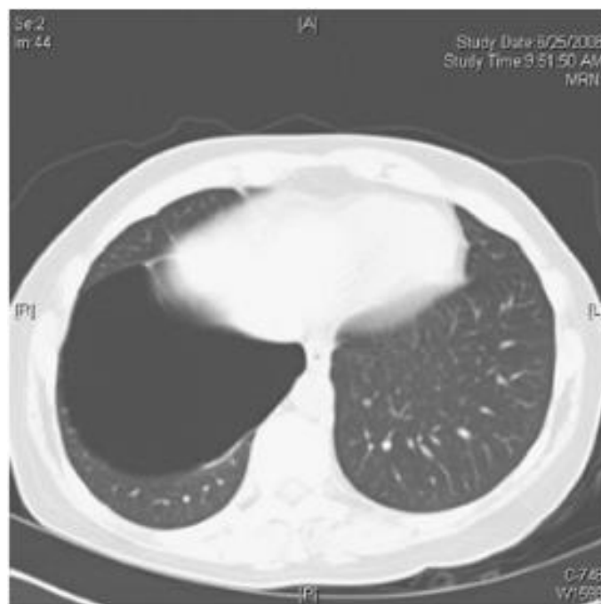
Slika 2. CT toraksa koji prikazuje veliku bulu u desnom, donjem režnju pluća

Preuzeto i modificirano prema: Shields TW, LoCicero J, Reed CE, Feins RH, editors. General Thoracic Surgery. 7th ed.: Lippincott Williams & Wilkins; 2009.