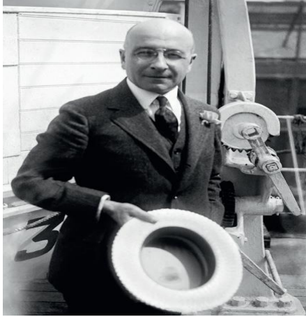
Slika 1. Alexis Carrel

Alexis Carrel (1873.- 1944.) rođen je u selu Sainte-Foy-Les kraj Lyona. Studirao je medicinu u Lyonu, gdje se nalazio vodeći medicinski fakultet u Europi tog vremena (Slika 1.). Radio je pod prismotrom vrhunskog kirurga Mathieusa Jabaulaya (1860.-1913.), koji je pridonio razvoju arterijske anastomoze. Tijekom studija, točnije 1894. godine dogodio se atentat na tadašnjeg predsjednika Francuske Sadiu Carnota (1837.-1894.). Francuski predsjednik zadobio je tešku smrtonosnu ubodnu ranu nožem, prilikom čega je došlo do težeg oštećenja portalne vene i velikog krvarenja. Taj događaj je ostavio veliki utjecaj na Alexisa Carrela. Kirurzi tog vremena još uvijek nisu znali adekvatno šivati krvne žile. Carrel je nakon toga uložio puno truda u rješavanju tog problema. Godine 1902. objavljuje rad o šivanju krvnih žila. On je razvio tehniku triangulacije u anastomoziranju krvnih žila pri čemu su postavljena 3 šava za zadržavanje na jednakoj udaljenosti kako bi se izazvala što manja trauma na krvnim žilama tijekom šivanja. (5) Shvatio je da su mnogi neuspjeli pokušaji u šivanju krvnih žila bili zbog stvaranja krvnih ugrušaka. Kako bi to spriječio koristio je male atraumatske igle, fini konac od svile koji bi podmazivao vazelinom. Poznat je bio i po tome što je često šivao držeći iglu prstima, a ne iglodržaćem. Posebnu pažnju je pridavao asepsi. Godine 1903. odlazi na