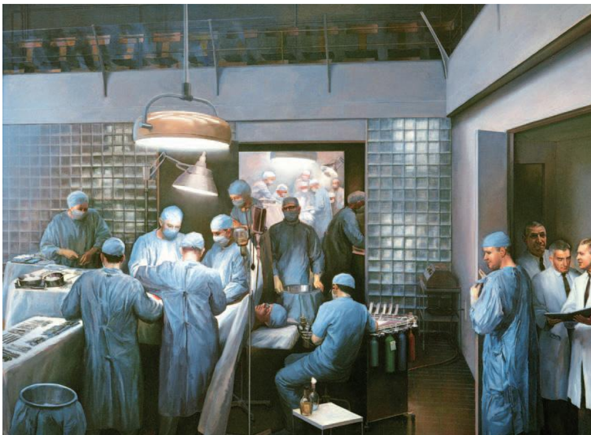
Slika 5. Prva uspješna transplantacija bubrega . Ulje na platnu