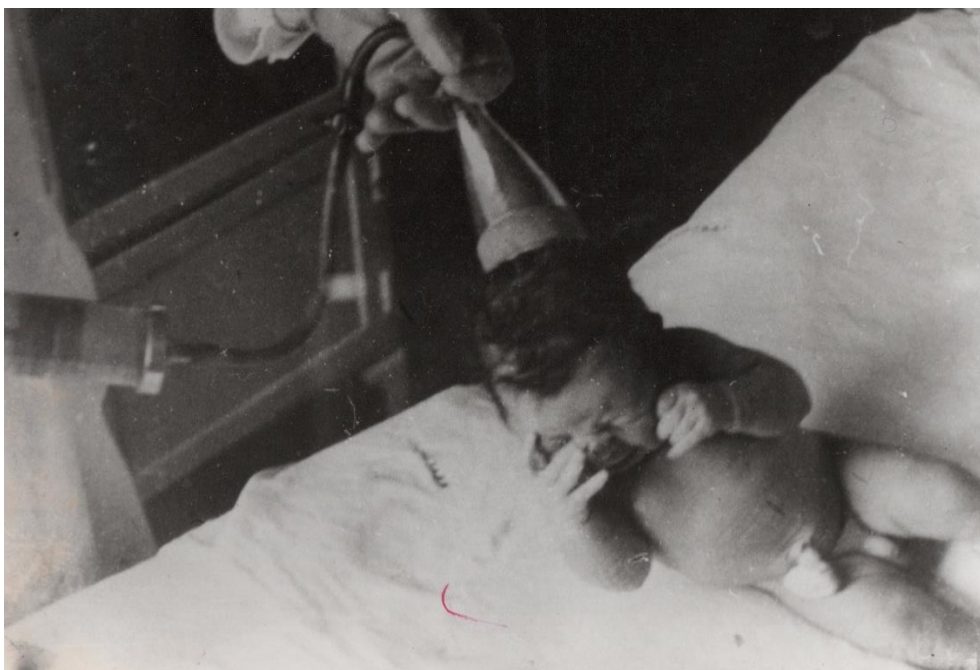
(SLIKA 3) Upravo rođeno dijete. Ekstraktor još na glavicu djeteta. (Originalni snimak)