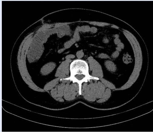
Slika 3. Kompjutorizirana tomografija (frontalni presjek) nakon ekstrakcije kamenaca ne pokazuje ostatne litijaze.

nom ultrazvuku oba bubrega su bila urednog sonografskog prikaza dok CT abdomena i zdjelice nije prikazao ostatnu litijazu niti dilataciju pijelokalicealnog sustava (slika 3). Pet mjeseci po operacijskom zahvatu pacijent je bez smetnji, zadovoljan kvalitetom života uz redovito provođenje intermitentne samokateterizacije.