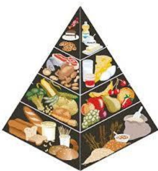
SLIKA 1.- Piramida pravilne prehrane

pripadaju voće i povrće, četvrtoj pripadaju mlijeko i mliječni proizvodi, petoj pripadaju meso, riba i jaja, te šestoj pripadaju masti, ulja i slatkiši (7). S obzirom na to da je pri samom dnu njena površina najveća, prva razina piramide predstavlja namirnice koje bi trebalo najčešće konzumirati. Hrana na vrhu piramide predstavlja skupine namirnica koje bi trebalo najmanje konzumirati. Prvoj, najnižoj razini pripadaju namirnice kao što su cjelovite žitarice, proizvodi od žita, kruh, smeđa riža, integralna tjestenina. Drugoj razini pripadaju voće i povrće. Trećoj razini pripadaju mlijeko i mliječni proizvodi, te meso, riba, jaja i mahunarke. Četvrtoj, ujedno i najvišoj razini pripadaju namirnice koje sadrže masnoće, šećer, sol i alkohol (7).