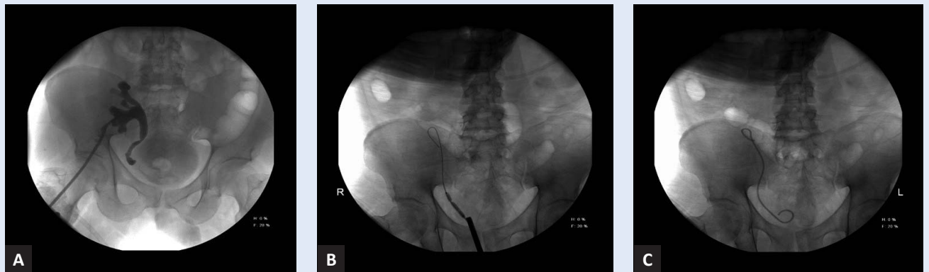
Slika 1. Retrogradna balonska dilatacija stenozne uretere transplantiranoga bubrega. Antegradnom snimkom dokazana je stenoza uretera (A), potom je učinjena retrogradna balonska dilatacija stenozne uretere (B) i postavljen JJ (C).

Razdoblje I: prvih 140 transplantacija s ureteroureteralnom anastomozom, razdoblje II: sljedećih 1020 transplantacija s ureterocistoneostomijom