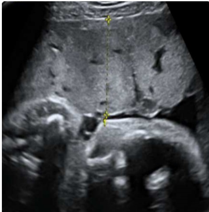
Slika 2. Ultrazvučni prikaz zadebljanje posteljice (1).

Sistemna fetalna infekcija zatim može zahvatiti brojne organe i prezentirati se različitim abnormalnostima ultrazvučnog nalaza, od hepatosplenomegalije, kardiomiopatije, kalcifikacijama brojnih organa te rjeđe fetalnim hidropsom. Kolestatski hepatitis i insuficijencija jetre rezultiraju ascitesom, a u kombinaciji s anemijom mogu dovesti do fetalnog hidropsa. Kardiomiopatija se očituje kardiomegalijom s hiperehogenim miokardom u kombinaciji s perikardijalnim ili pleuralnim izljevom (32).