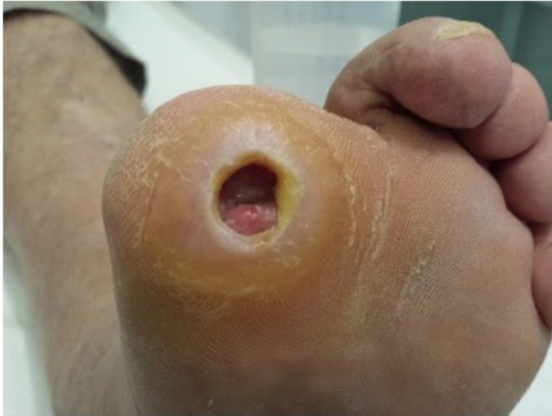
Slika 3. Ulkus dijabetičkog stopala (69)

dijabetičkom stopalu katastrofalnije nego drugdje uglavnom zbog određenih anatomskih osobitosti. Stopalo ima nekoliko odjeljaka koji međusobno komuniciraju i infekcija se može proširiti iz jednog u drugi, a nedostatak boli omogućuje pacijentu da nastavi s hodanjem dodatno olakšavajući širenje infekcije. Kombinacija neuropatije, ishemije i hiperglikemije pogoršava situaciju smanjujući obrambene mehanizme (69).