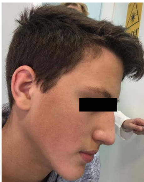
Slika 3. Keratosis pilaris na obrazima.