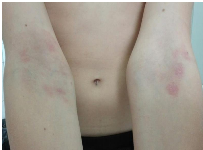
Slika 2. Atopijski dermatitis dječje dobi.