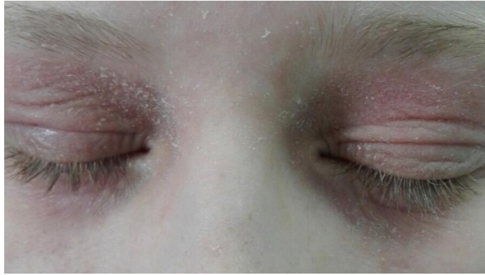
Slika 4. Atopijski dermatitis vjeda, periorbitalni edem i Dennie-Morgan linije.