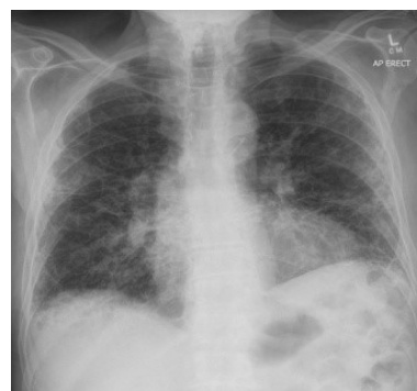
Slika 2. Intersticijska pneumonija

https://radiopaedia.org/articles/lobar-pneumonia?lang=us