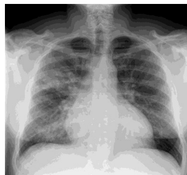
Slika 3. Bronhopneumonija

https://radiopaedia.org/cases/usual-interstitial-pneumonia-type-pattern?lang=us