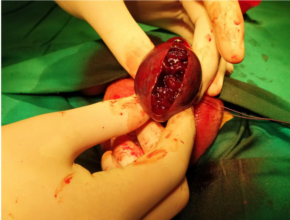
Slika 4. Nakon 6 sati počinje nekroza testisa - zarezivanjem testisa ne vidi se aktivno krvarenje

starije djece i one pubertetske dobi postoji mogućnost postavljanja proteze koja za ulogu ima smanjiti psihološki strah od izgleda skrotuma nakon uklanjanja testisa (3, 4).