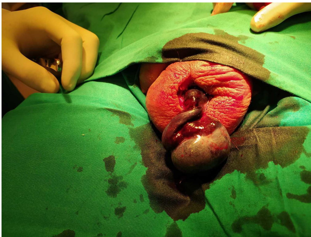
Slika 1. Intraoperativni prikaz torkviranog testisa