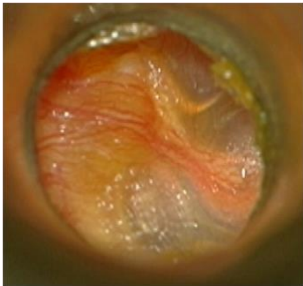
Slika 1. Sekretorni otitis Figure 1 Secretory otitis media