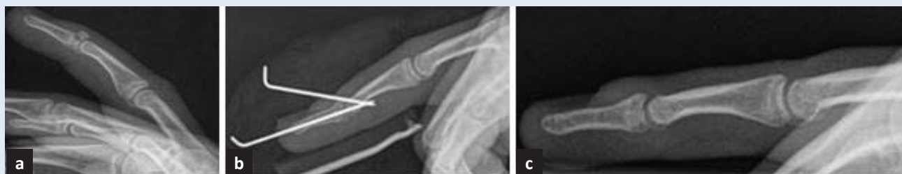
Slika 2. Liječenje koštanog čekićastog prsta: a – prijeoperacijska RTG slika; b – rana poslijeoperacijska RTG slika; c – poslijeoperacijska RTG slika nakon odstranjenja K-žica