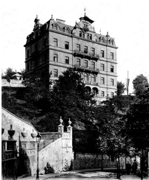
Slika 1. Karlovy Vary (njem. Karlsbad), Češka, Časničko lječilište Društva Bijeli križ .