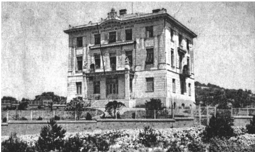
Slika 7. Mali Lošinj, Časničko lječilište Društva Bijeli križ .

bečki bankar Rothschild, a svečanom otvaranju prisustvovao je i general Oskar Potiorek. 34