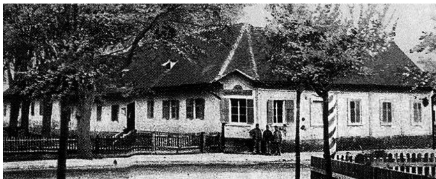
Slika 3. Topusko, Vojničke kupke.

lječilišnim mjestima u kontinentalnoj Hrvatskoj upućuju nas fotografije i njihove monografije poput onih iz Topuskog.