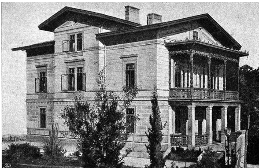
Slika 4. Opatija, Časničko lječilište Društva Bijeli križ .

Osim glavnih medicinskih tretmana, gostima se nudilo i druge povoljnosti: 15 – 20 %-tni popust u nekim hotelima i pivnicama, 50 %-tni popust u ordinaciji zubara Altera, zatvorenom javnom kupalištu Nadvojvoda Ludvig