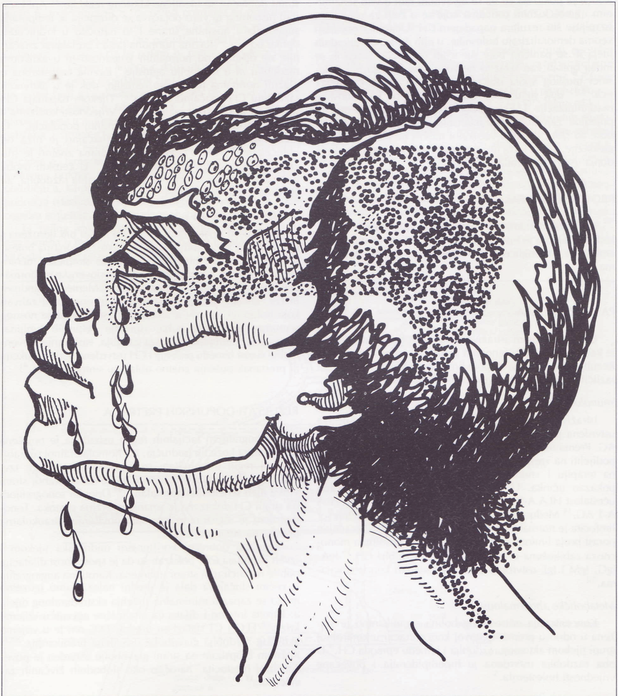
Slika 1 Cluster glavobolja (rad akad. slikara M. Solisa)