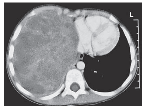
Slika 3. Pleuropulmonalni blastom tip III. CT prsnih organa prikazuje solidnu tvorbu koja ispunjava cijelu desnu polovicu prsišta (strelica).

PPB je genetička bolest. Obiteljsko javljanje s mutacijama gena DICER1 javlja se u 25% bolesnika i udruženo je s renalnim tumorima (31). U članova obitelji češći su germinativni tumori, tumori mozga, tiroidni tumori, limfomi, leukemije, sarkomi i histiocitoza. Histološki se PPB u djece razlikuje od tumora u odraslih po svojoj primitivnoj i embrionalnoj stromi, odsutnosti karcinomatозne komponente i potencijalu sarkomatозne diferencijacije. PPB se dijeli u tri histološka tipa: tip I. - cističan (prosječna dob 10 mjeseci); tip II. - građen od cistične i so-