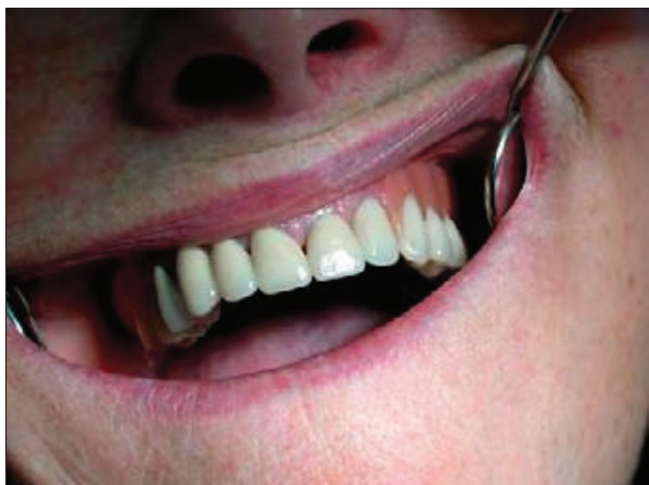
Slika 7.1. Lom krilnog mosta

Na većinu ovih čimbenika može se pozitivno utjecati i fiksnom nadomjestku odrediti svojstva po želji. Mehanička svojstva najviše ovise o izboru materijala, a zatim o stupnju njegove obrađenosti. Mehanički nepostojan nadomjestak (neadekvatne tvrdoće, čvrstoće, elastičnosti) može se brzo oštetiti i/ili slomiti (7). Pacijent u ordinaciju dolazi tek kada primijeti značajnija oštećenja-puknuća ili klimavost (Slika 7.1.).