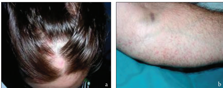
Slika 3.3. Bolesti povezane s oralnim žarištem; a - alopecija areata, b - vaskulitis kože

Brojna su istraživanja pokazala povezanost parodontitisa sa sustavnim bolestima kao što su dijabetes melitus, kardiovaskularne bolesti, respiratorne bolesti te prijevremeni porod i rođenje djece s niskom porođajnom težinom (15-20) (detaljnije opisano u sljedećem poglavlju).