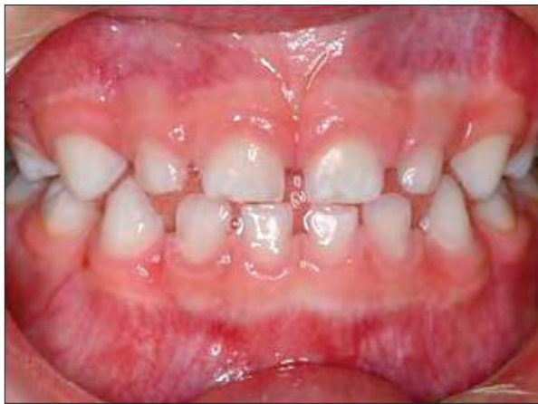
Slika 5.1. Zdrava mliječna denticija

Karijes je jedna od najučestalijih bolesti u djetinjstvu (1), a najveći postotak karijesnih zuba nađen je kod trogodišnjaka (2).