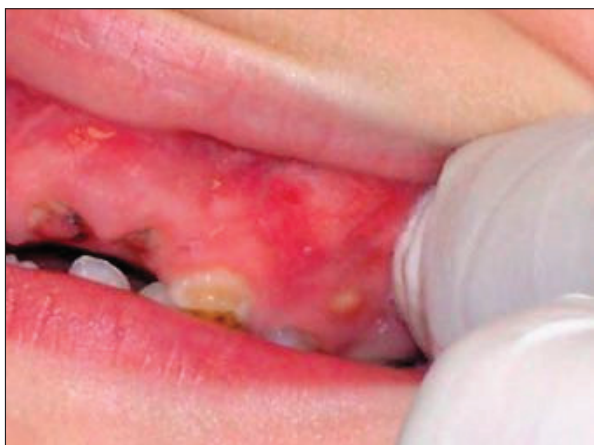
Slika 5.5. Fistula kao posljedica ECC-a

Pojavom jednog ili više problema koje uzrokuje ECC, razvija se strah od stomatološkog tretmana ( slike 5.5. i 5.6. ).