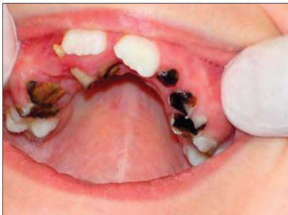
Slika 5.4. Karijes u mješovitoj denticiji

Razdoblje mješovite denticije počinje nicanjem prvog trajnog zuba, što je najčešće u dobi između šest i sedam godina. Tada niču prvi trajni kutnjaci, koji nemaju svojega prethodnika pa njihovo pojavljivanje u usnoj šupljini često prođe nezapaženo. Morfologija okluzalne plohe prvih trajnih kutnjaka karakteristična je zbog izraženih jamica, fisura i brazda, koje čine predilekcijsko mjesto za nastanak karijesa. Loša oralna higijena, nepravilna prehrana i već prisutne kavitacije na mliječnim zubima neminovno dovode do širenja karijesa na tek izniknule trajne zube koji imaju hipomaturiranu caklinu.