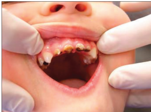
Slika 5.2. Cirkumferentna lezija u području vrata zuba

ECC ima izrazito brz razvoj i može zahvatiti pulpu zuba prije nego se bilo što poduzme u njegovom liječenju ( slika 5.3. ) (6).