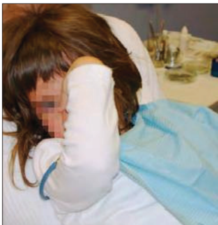
Slika 5.6. Izražavanje straha od stomatološkog zahvata