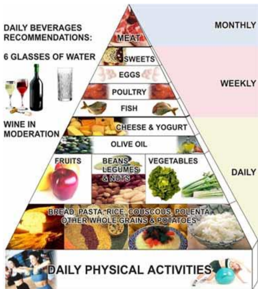
Slika 1. Piramida tradicionalne mediteranske prehrane