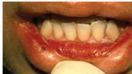
Slika 2. Ulceracije sluznice. Preuzeto iz 10.