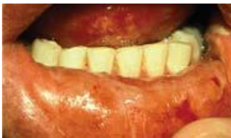
Slika 3. Konfluirajuće ulceracije.