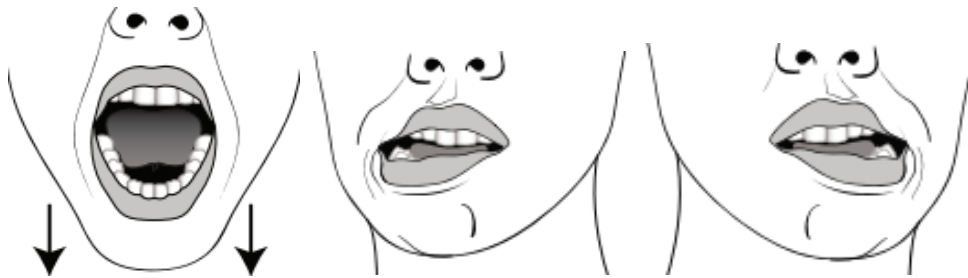
Slika 8. Aktivne vježbe istezanja mastikatornih mišića. Preuzeto iz 18.

i pasivnih vježbi istezanja mišića čeljusti tako da postavi palac jedne ruke na gornje zube, kažiprst druge ruke na donje zube i pritom otvara usta prstima do granice boli te zadrži u tom položaju par sekundi (18).