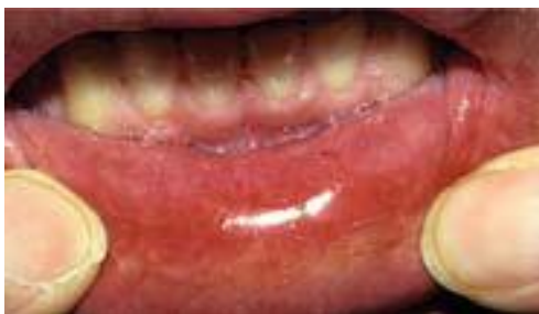
Slika 1. Eritem sluznice. Preuzeto iz 10.

Svjetska zdravstvena organizacija klasificira mukozitis u četiri stupnja (slike 1-4) (3,10). Stupanj 0 nema znakova i simptoma. Stupanj 1 karakteriziran je pojavom boli i eritemom oralne sluznice. U 2. stupnju bolesnik ima ulkuse i ne može normalno jesti, u 3. stupnju može piti samo tekućinu, dok u 4. stupnju ne može ni jesti ni piti (3).