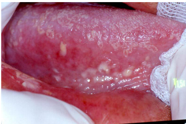
Slika 6. Pseudomembranozna kandidijaza. Preuzeto iz 14.

Bolesnikovi subjektivni simptomi su bol i/ili osjećaj pečenja (3). Nakon postavljene dijagnoze pristupa se liječenju. Najčešće korišteni topikalni protugljivični lijekovi su ketokonazol, klotrimazol krema ili pastile te 0,12%-tna otopina klorheksidina. Otopinu nistatina se ne preporučuje zbog velikog udjela saharoze čime se povećava rizik od nastanka karijesa. Kod težih infekcija potrebna je i upotreba sustavnih protugljivičnih lijekova (flukonazol, itrakonazol) (6,7). Inficirane protetske nadomjestke potrebno je dnevno namakati 30 minuta u otopini klorheksidina (0,12%) ili u razrijeđenoj otopini natrij hipoklorita (dvije čajne žličice 5% natrijhipoklorita u 250 ml vode) (7).