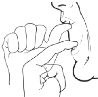
Slika 9. Pasivna vježba istezanja mišića. Preuzeto iz 18.

U nekih bolesnika zamijećeno je poboljšanje nakon primjene botulinum toksina i pentoksifilina koji utječe na fibrogensku produkciju citokina. U teškim slučajevima indicirana je koronoidektomija (17).