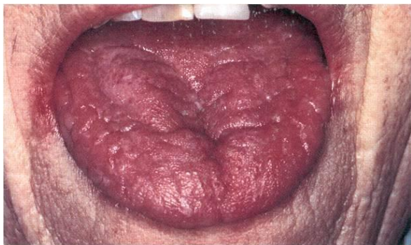
Slika 5. Kserostomija. Preuzeto iz 13.

Kserostomija ili suhoća usta je najneugodnija neželjena popratna pojava radioterapije glave i vrata (slika 5) (3, 13).