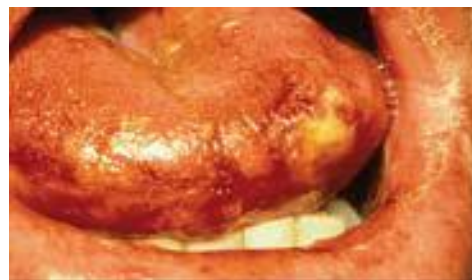
Slika 4. Nekroza tkiva.