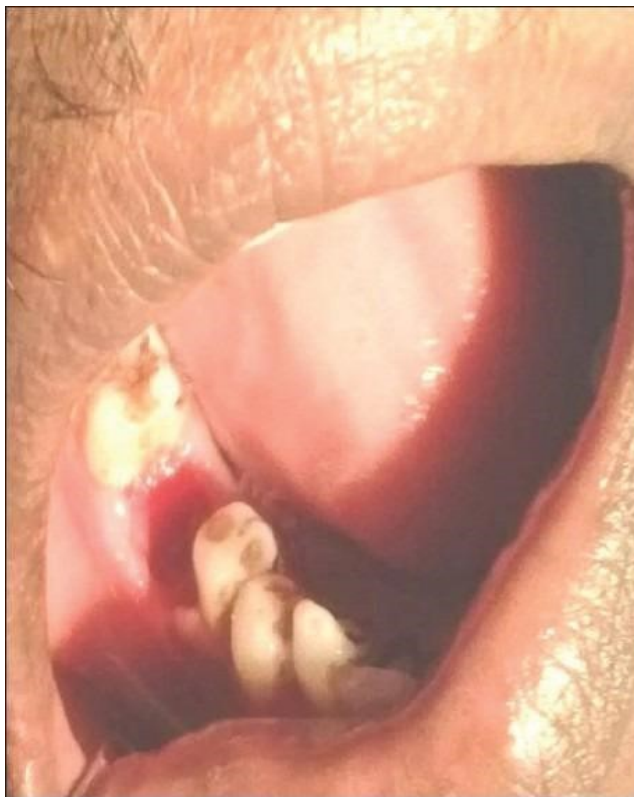
Slika 3: Nakon 2. tretmana medom.