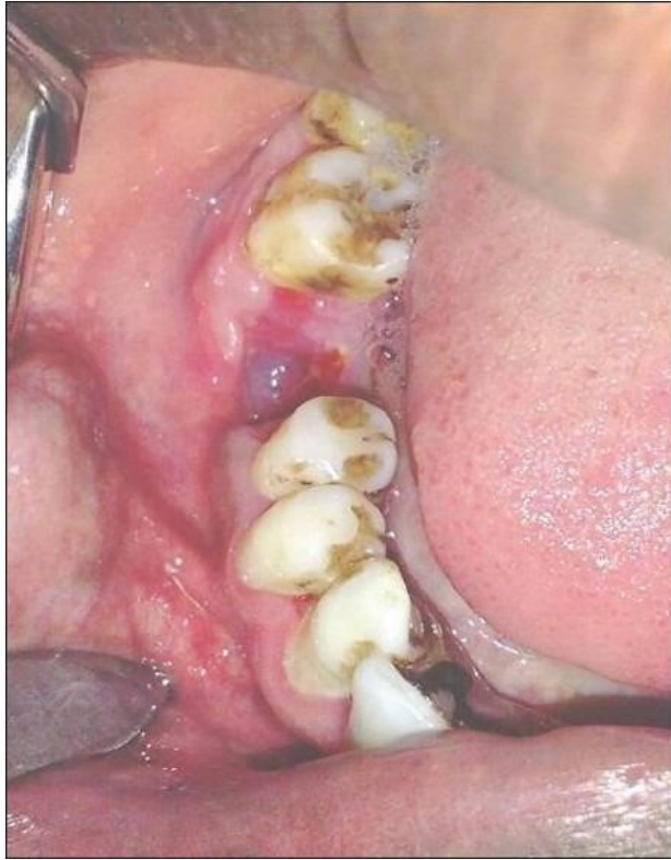
Slika 2: Nakon 1.tretmana medom. Preuzeto iz: (14).