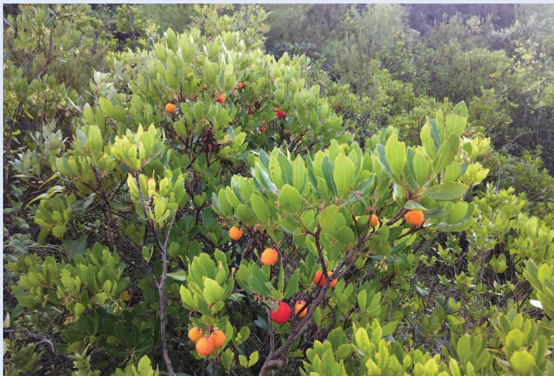
Slika 2. Obična planika, Orebić, 2017.

Korijen i osušeni list ove biljke koriste se u mediteranskim zemljama kao pomoć kod određenih oboljenja, pa tako i kod urinarnih infekcija (slika