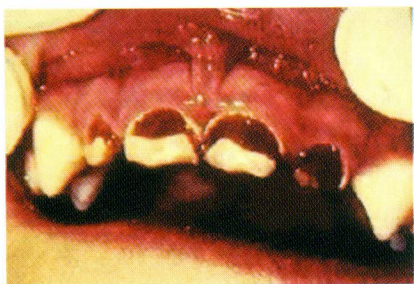
Slika 1. Karijes u području vrata zuba Figure 1 Caries parallel the gum line

molare, a mliječni donji središnji sjekutići ostaju zdravi. 6,13 Kružno oštećenje (slika 1.), pokazuje krajnje brzi razvoj, i može zahvatiti pulpu zuba prije negoli se bilo što poduzme u njegovu liječenju (slike 2. i 3.).