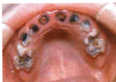
Slika 3. Ekspozirana zubna pulpa Figure 3 Exposed dental pulp