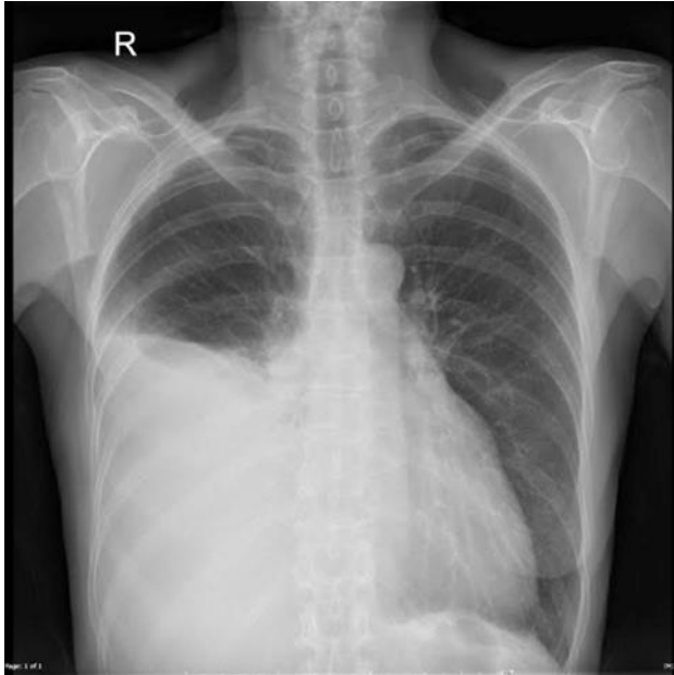
Slika 4: Maligni pleuralni izljev

nastanka adhezija između dva lista pleure i obliteracije prostora između njih. U vrlo slabih pacijenata od kojih se ne očekuje dugoročno preživljenje bolje je ponavljati torakocentezu. (6)