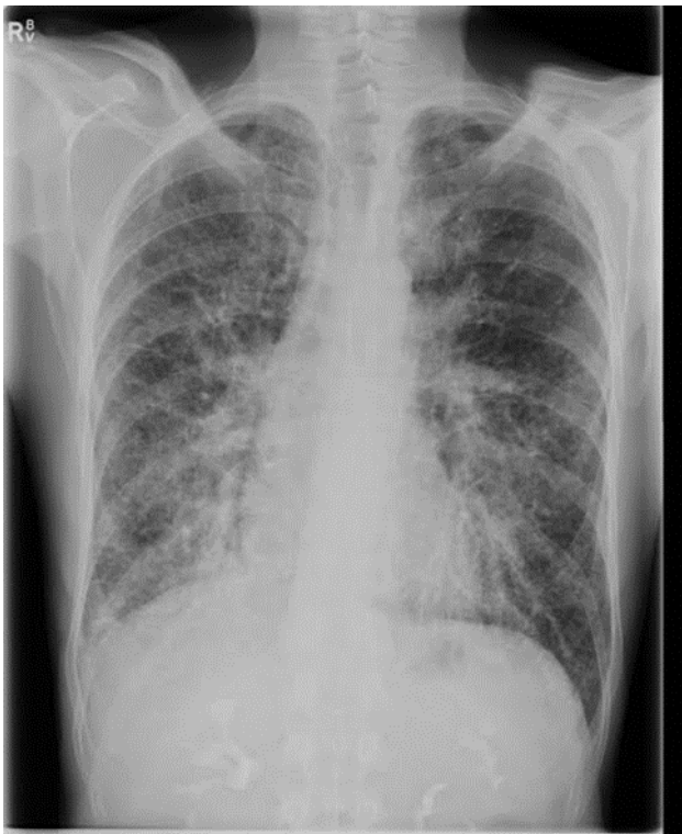
Slika 1: Karcinomatozni limfangitis

Metastaze u područje medijastinuma, naročito u područje rebara uzrokuju teži stupanj dispneje. Razvoj malignih novotvorina može dovesti do poremećaja drugih sustava, slabljenja organizma te posljedično razvoja drugih stanja koja mogu uzrokovati otežano disanje kao što su razvoj anemije, kaheksije ili plućne embolije. Može se pojaviti kod pacijenata koji su podvrgnuti kemoterapiji. Utvrđeno je da je dispneja jedan od simptoma starijih pacijenata oboljelih od raka koji su podvrgnuti kemoterapiji i koji pate od anemije i neutropenije. (9)