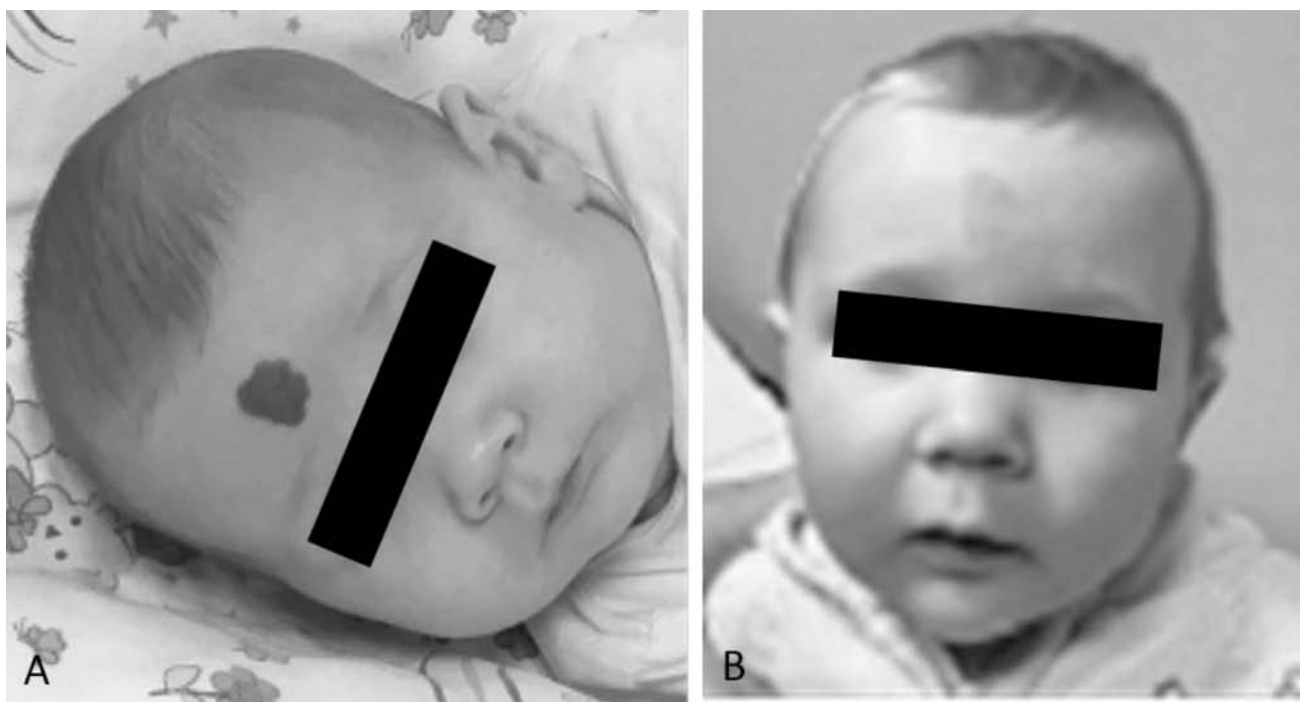
Slika 2. A. Hemangiom u četveromjesečnog ženskog dojenčeta. B. Nakon 3 mjeseca terapije propranololom (Vlastiti bolesnik)