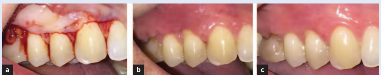
Slika 2. Primjena PRF membrane kod prekrivanja višestrukih gingivnih recesija. (a) Postavljanje PRF membrane; (b) Cijeljenje nakon 2 tjedna; (c) Cijeljenje nakon 5 mjeseci.