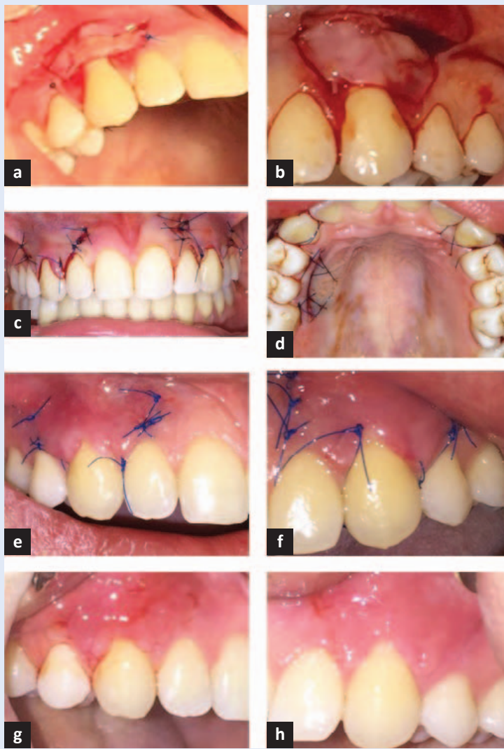
Slika 3. Postupak prekrivanja izolirane gingivne recesije KMR-om uz dodatak PRF membrane, na desnoj, i SVT-a, na lijevoj strani. (a) Postavljanje vezivnotkivnog transplantata kod prekrivanja jednostruke gingivne recesije 13; (b) Postavljanje PRF membrane kod prekrivanja jednostruke gingivne recesije 23; (c) Neposredno po završetku operativnog postupka, prekrivene recesije 13 i 23; (d) Sluznica nepca s koje se uzeo transplantat vezivnog tkiva; (e) KMR sa SVT-om – cijeljenje nakon tjedan dana; (f) KMR s PRF-om – cijeljenje nakon tjedan dana (g) KMR sa SVT-om – cijeljenje nakon 2 tjedna; (h) KMR s PRF-om – cijeljenje nakon 2 tjedna.

prikazan je postupak prekrivanja višestrukih gingivnih recesija KMR-om uz dodatak PRF membrane.