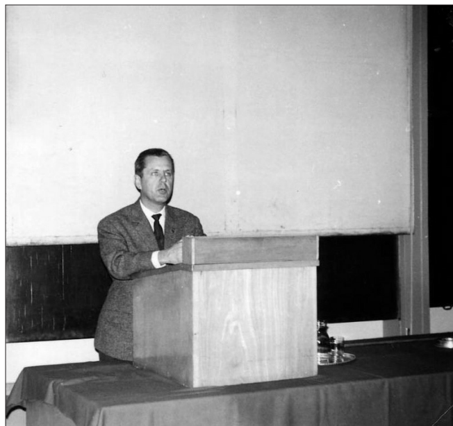
Slika 7 – Prof. dr. sc. Marijan Kolombo, Predsjednik Društva 1974.–1980.

U početku je radio u Kontrolnom laboratoriju, zatim je osnovao i vodio Istraživački laboratorij. Godine 1964. na Zagrebačkom sveučilištu stekao je zvanje doktora kemijskih znanosti. Iste je godine postavljen za direktora Službe za razvoj i istraživanje, koju je vodio idućih dvadeset godina. To je bilo vrijeme najvećeg razvoja i Riječke rafinerije i petrokemijske industrije na otoku Krku. Kao istaknuti stručnjak izabran je 1968. za eksperta UNIDO-a, Organizacije UN-a za industrijski razvoj, a godinu dana poslije postao je redovni član Znanstvenog savjeta za naftu pri Hrvatskoj akademiji znanosti i umjetnosti. Bio je na specijalizaciji u Engleskoj, Belgiji i SAD-u, gdje je usavršavao teoretska znanja. Sudjelovao je na šest svjetskih kongresa za naftu, a 2002. izabran je u Akademiju tehničkih znanosti Hrvatske.