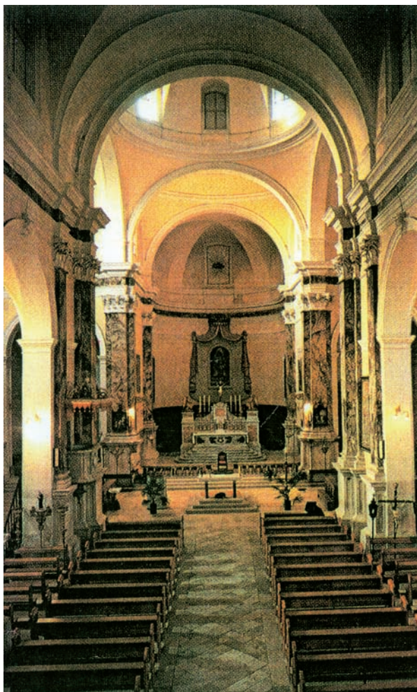
Slika 1. Unutrašnjost župne crkve sv. Blaža u Vodnjanu

neobično velikom broju sačuvanih relikvija u nas, autori su 1993. odlučili krenuti u preliminarno istraživanje. Za početak odabrana je crkva sv. Blaža u Vodnjanu (slika 1), koja je nadaleko poznata upravo po brojnim relikvijama, poglavito neraspadnutim tijelima nekoliko svetih i blaženih.