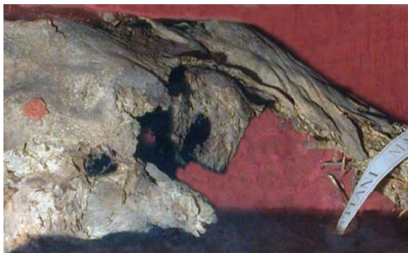
Slika 3. Dio zdjelice i desne natkoljenice sv. Sebastijana

Desni je femur (slika 3) sačuvan u čitavoj dužini osim samih kondila koji su koso presječeni. Dvije proksimalne trećine stražnje i lateralne površine kosti pokrivena su kožom koja se na granici s distalnom trećinom resičasto cijepa. Proksimalne dvije trećine medijalne površine su tek djelomično prekrivene mišićnim mostićima, dok je u distalnoj trećini vidljiva samo kost.