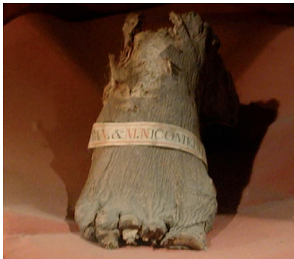
Slika 5. Lijevo stopalo sv. Barbare

je prst sačuvan osim manjeg oštećenja kože nad srednjim člankom. Peti je prst potpuno sačuvan. Koža dorzuma nabrana je u plitki nabor koji se račva poput obrnutog slova y okružujući nokat (slika 5).