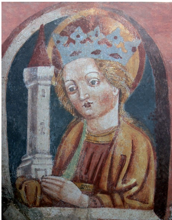
Slika 4. Sv. Barbara na fresci Ivana iz Kastva, 1490., crkva svetog Trojstva u Hrastovlju, u Istri

štitnike vatrogasaca. S tim u svezi na njezinim su slikama često zvana, kojima se oglašavaju opasnosti (slika 4). Tako je postala zaštitnicom ljevača zvana. Tu bi negdje valjalo smjestiti i topnike. S medicinskog motrišta zanimljiva nam je kao zaštitnica od vrućice i iznenadne smrti, u životnim opasnostima, te je i jedna od 14-ero svetih pomoćnika (6, 7).