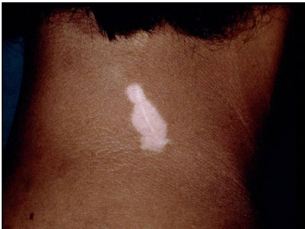
Slika 5. Pozitivan Köbnerov fenomen

uha i leptomeninga također mogu biti zahvaćeni vitiligom. Depigmentirana područja retinalnog pigmentnog epitela i žilnice zabilježena su u 30 do 40% oboljelih (47). Ove asimptomatske lezije ne utječu na vidnu oštrinu.