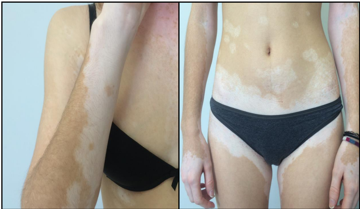
Slika 2. Depigmentacije u vitiligu

Vitiligo se obično očituje pojavom asimptomatskih hipopigmentiranih, a nedugo zatim i depigmentiranih makula i plakova, mliječne ili kredasto bijele boje, bez kliničkih znakova upale. Ozbiljnije opekline od sunca, trudnoća, trauma kože i/ili emocionalni stres mogu prethoditi nastupu bolesti. Lezije se mogu pojaviti u bilo kojoj dobi i bilo gdje na tijelu, s predilekcijom za lice i perioralno područje, genitalnu regiju i ruke. Variraju veličinom od nekoliko milimetara do nekoliko centimetara i obično imaju konveksne granice dobro ograničene od okolne normalne kože.