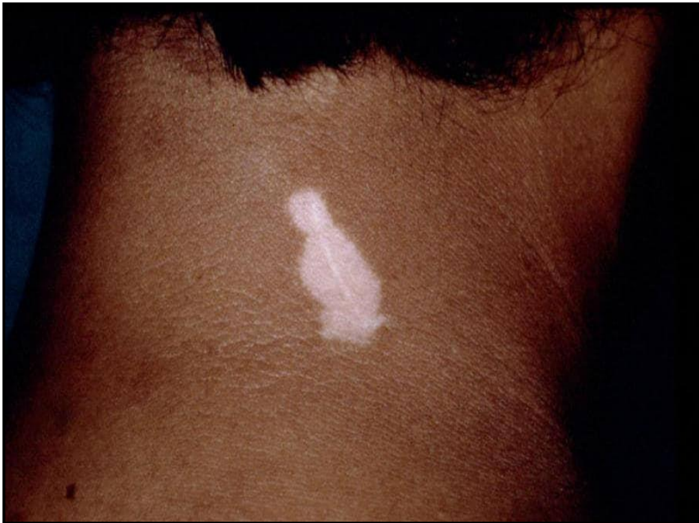
Slika 5. Pozitivan Köbnerov fenomen

uha i leptomeninga također mogu biti zahvaćeni vitiligom. Depigmentirana područja retinalnog pigmentnog epitela i žilnice zabilježena su u 30 do 40% oboljelih (47). Ove asimptomatske lezije ne utječu na vidnu oštrinu.