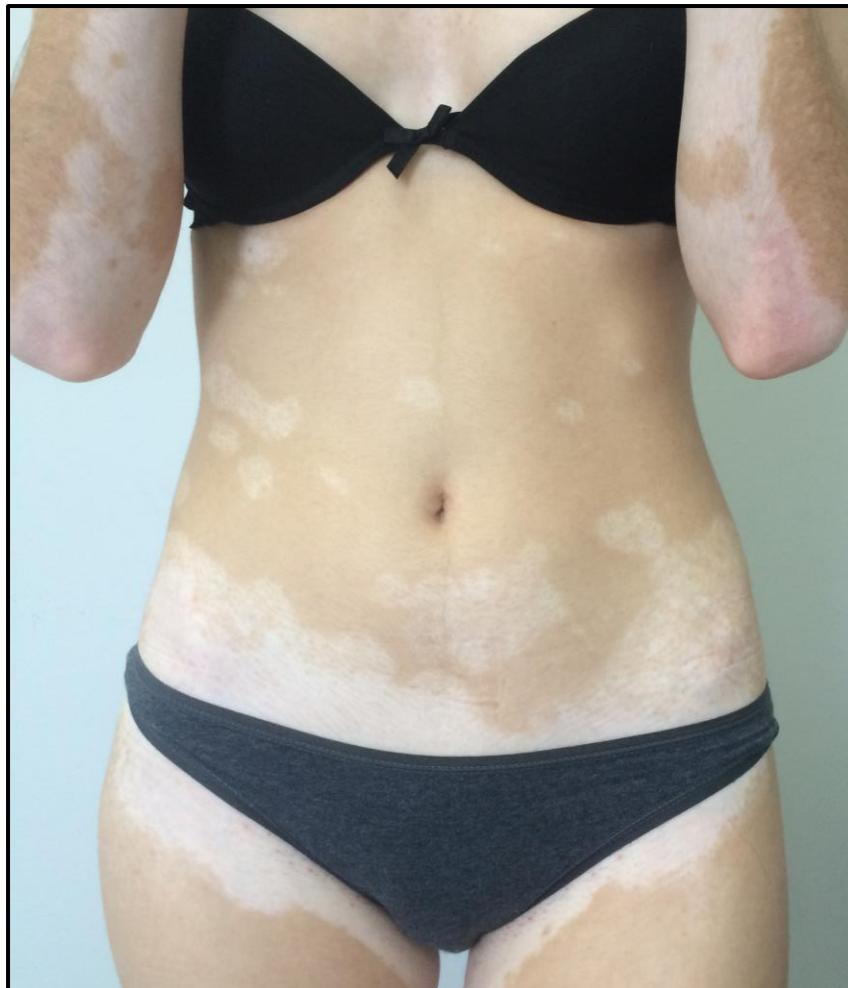
Slika 3. Generalizirani vitiligo