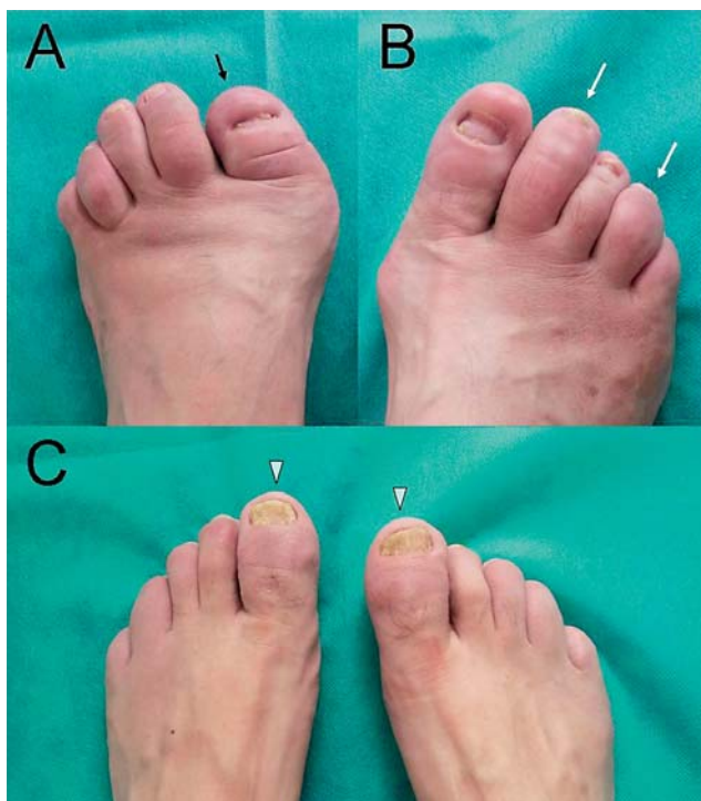
SLIKA 1. Tipične promjene zglobova i noktiju na stopalu u bolesnika sa psorijatičnim artritismom

Ipak, s vremenom se pokazalo da je podjela prema Mollu i Wrightu nedostatna jer se u nekih bolesnika bolest javlja u više od jednoga zglobnog obrasca ili se