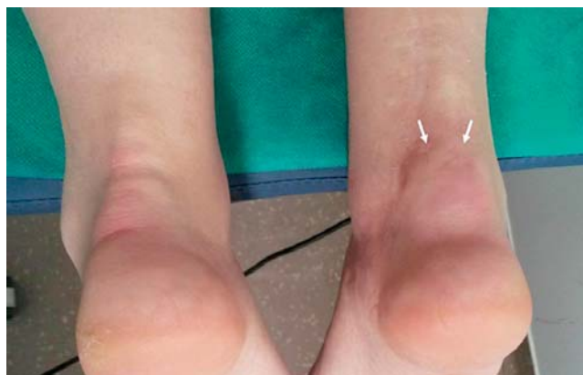
SLIKA 3. Entezitis Ahilove tetive FIGURE 3 Achilles tendon enthesitis