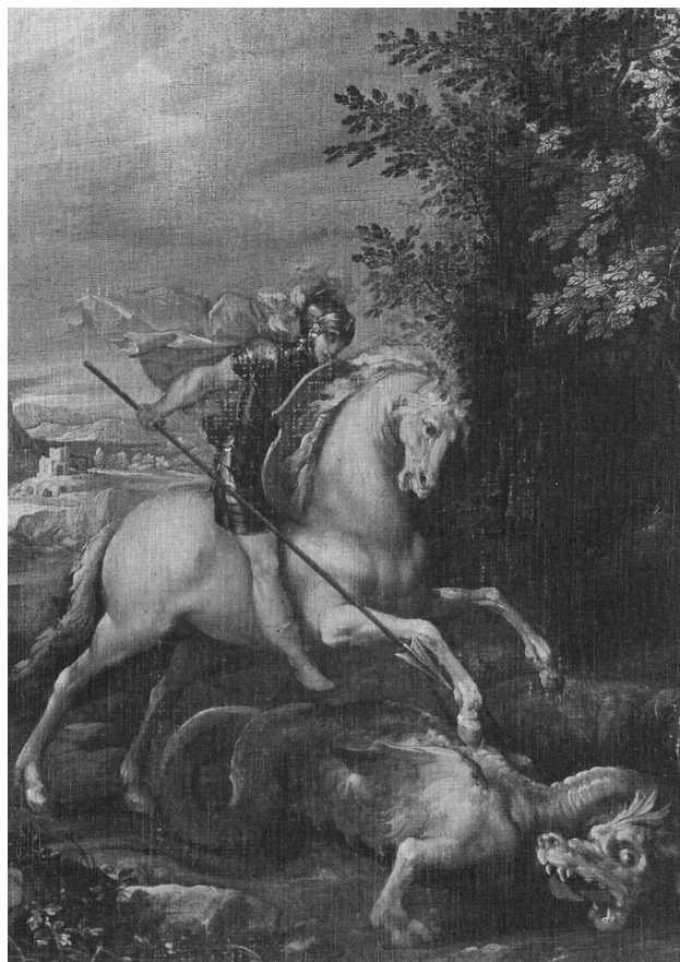
Slika 3. Giuseppe Cesari zv. Cavaliere d'Arpino (1568.-1640.): Sveti Juraj ubija zmaja. Strossmayerova galerija, Hrvatska akademija znanosti i umjetnosti, Zagreb

jatnijim legendama Juraj je rođen 280. godine, na obali Crnoga mora, u blizini ušća Dunava. Izučivši vojne vještine, postaje Dioklecijanovim časnikom, ali će zbog prihvaćanja kršćanstva biti podvrgnut torturi i na kraju pogubljen. Kao jedan od najštovanijih svetaca uvršten je među tzv. četrnaest svetih pomoćnika, a kao zaštitnik vezuje se uz bolesti s visokom temperaturom, epilepsiju i kugu. Dodatno mu je povjerena i zaštita od bolesti domaće stoke te posebno konja i ratne konjice. Iz asocijacije s njegovim blagdanom 23. travnja, kada prema pučkom vjerovanju počinje "oživljavati" zemlja, izabran je za zaštitnika usjeva, a kako se u to doba počinju pojavljivati zmije, izabran je i za zaštitnika od njihova ujeda (Slika 3).