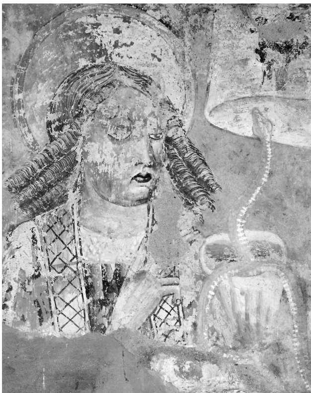
Slika 2. Vincent iz Kastva: Sv. Ivan Evadelist sa zmijom koja izlazi iz kaleža s otrovnim vinom. Freska iz 1474. u crkvi sv. Marije na Škrilinah u Bermu, Istra.

naškoditi. Ivan se nije dao zbuniti. Uvjeren u ispravnost onoga što je govorio, odlučno je prihvatio čašu. A zatim se dogodilo čudo – otrov uobličen u zmiju sâm je izašao iz kaleža te je Ivan bez posljedica ispio preostalo vino. Razumije se da je to bio dovoljno dojmljiv argument najprije u prilog ispravnosti njegovih propovijedi, da bi kasnije iz toga u pobožnom puku zaživjelo i vjerovanje u zaštitničke sposobnosti tog sveca vezano za ugrize otrovnih zmija (Slika 2).