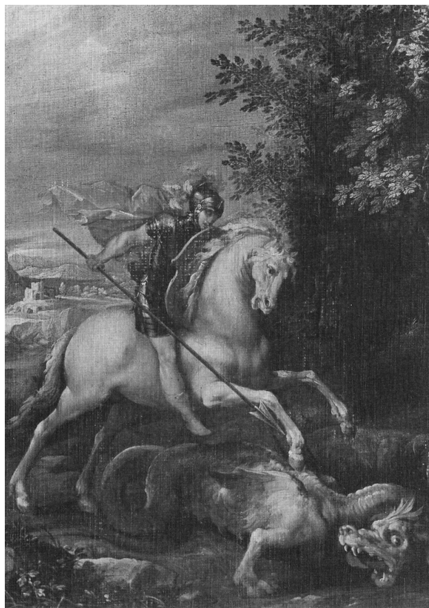
Slika 3. Giuseppe Cesari zv. Cavaliere d'Arpino (1568.-1640.): Sveti Juraj ubija zmaja. Strossmayerova galerija, Hrvatska akademija znanosti i umjetnosti, Zagreb

jatnijim legendama Juraj je rođen 280. godine, na obali Crnoga mora, u blizini ušća Dunava. Izučivši vojne vještine, postaje Dioklecijanovim časnikom, ali će zbog prihvaćanja kršćanstva biti podvrgnut torturi i na kraju pogubljen. Kao jedan od najštovanijih svetaca uvršten je među tzv. četrnaest svetih pomoćnika, a kao zaštitnik vezuje se uz bolesti s visokom temperaturom, epilepsiju i kugu. Dodatno mu je povjerena i zaštita od bolesti domaće stoke te posebno konja i ratne konjice. Iz asocijacije s njegovim blagdanom 23. travnja, kada prema pučkom vjerovanju počinje "oživljavati" zemlja, izabran je za zaštitnika usjeva, a kako se u to doba počinju pojavljivati zmije, izabran je i za zaštitnika od njihova ujeda (Slika 3).