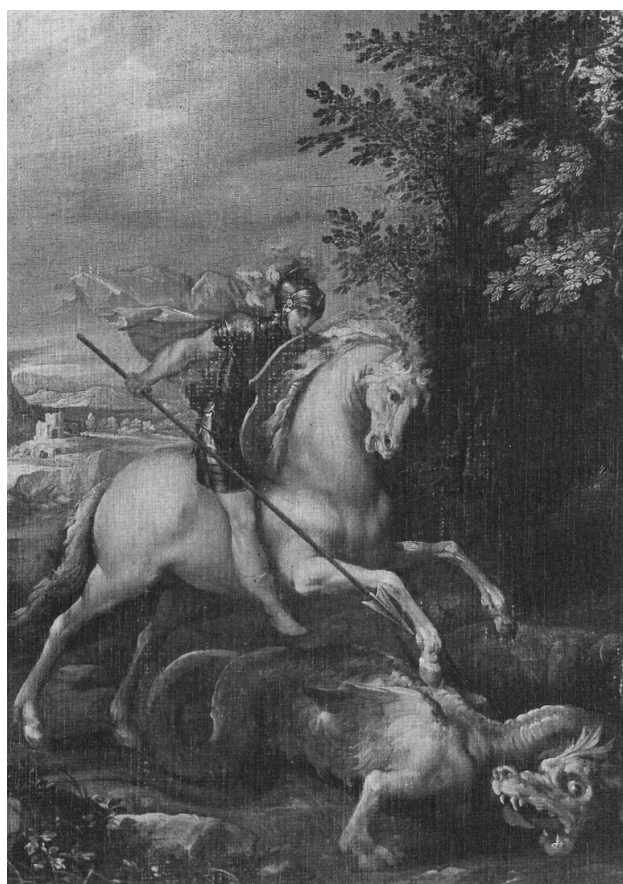
Slika 3. Giuseppe Cesari zv. Cavaliere d'Arpino (1568.-1640.): Sveti Juraj ubija zmaja. Strossmayerova galerija, Hrvatska akademija znanosti i umjetnosti, Zagreb

jatnijim legendama Juraj je rođen 280. godine, na obali Crnoga mora, u blizini ušća Dunava. Izučivši vojne vještine, postaje Dioklecijanovim časnikom, ali će zbog prihvaćanja kršćanstva biti podvrgnut torturi i na kraju pogubljen. Kao jedan od najštovanijih svetaca uvršten je među tzv. četrnaest svetih pomoćnika, a kao zaštitnik vezuje se uz bolesti s visokom temperaturom, epilepsiju i kugu. Dodatno mu je povjerena i zaštita od bolesti domaće stoke te posebno konja i ratne konjice. Iz asocijacije s njegovim blagdanom 23. travnja, kada prema pučkom vjerovanju počinje "oživljavati" zemlja, izabran je za zaštitnika usjeva, a kako se u to doba počinju pojavljivati zmije, izabran je i za zaštitnika od njihova ujeda (Slika 3).