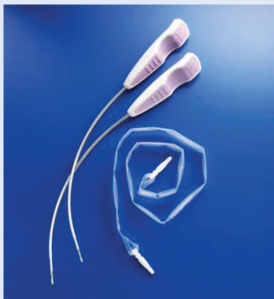
Slika 3. Primjer kirurškog sling seta koji se koristi u liječenju stresne inkontinencije

tehnike uobičajeno se ovisno o tipu zahvata inseriraju u regionalnoj ili lokalnoj anesteziji te najčešće zahtijevaju jednodnevnu hospitalizaciju uz profilaktičnu uporabu antibiotika.