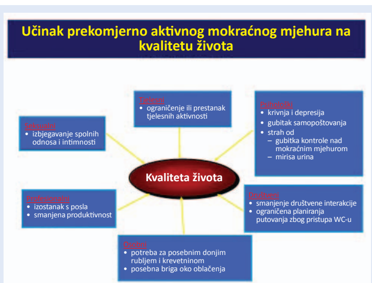
Slika 4. Utjecaj prekomjerno aktivnog mokraćnog mjehura na različite sfere života

S obzirom na prisutnost ili odsutnost urgentne inkontinencije prekomjerno aktivni mokraćni mjehur možemo podijeliti na tzv. „suhi“, kod kojeg