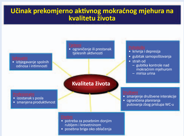
Slika 4. Utjecaj prekomjerno aktivnog mokraćnog mjehura na različite sfere života

S obzirom na prisutnost ili odsutnost urgentne inkontinencije prekomjerno aktivni mokraćni mjehur možemo podijeliti na tzv. „suhi“, kod kojeg