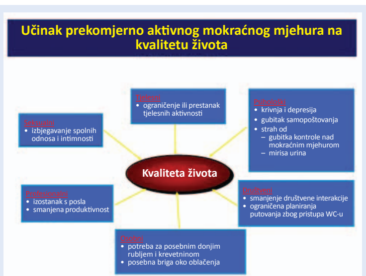
Slika 4. Utjecaj prekomjerno aktivnog mokraćnog mjehura na različite sfere života

S obzirom na prisutnost ili odsutnost urgentne inkontinencije prekomjerno aktivni mokraćni mjehur možemo podijeliti na tzv. „suhi“, kod kojeg