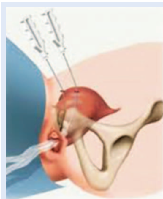
Slika 1. Shematski prikaz retropubičnog pristupa u liječenju stresne inkontinencije

Od pionirskih zahvata Ulmstena 1995. godine razvile su se do današnjih dana brojne tehnike koje imaju bazično razliku u pristupu koji može biti retropubični (TVT, SPARC – slika 1), potom transobturatorni (TVT-0, Monarc) 5,6 .