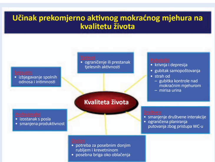
Slika 4. Utjecaj prekomjerno aktivnog mokraćnog mjehura na različite sfere života

S obzirom na prisutnost ili odsutnost urgentne inkontinencije prekomjerno aktivni mokraćni mjehur možemo podijeliti na tzv. „suhi“, kod kojeg