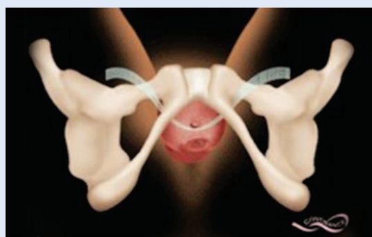
- TOT (Transobturator vaginal tape)