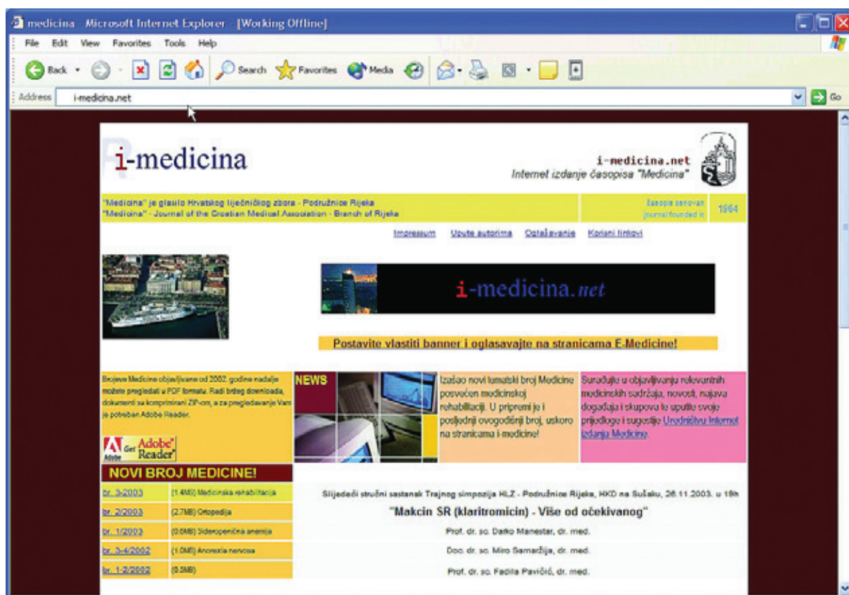
Slika 1. Prva naslovnica internetskog izdanja Medicine (2003.)