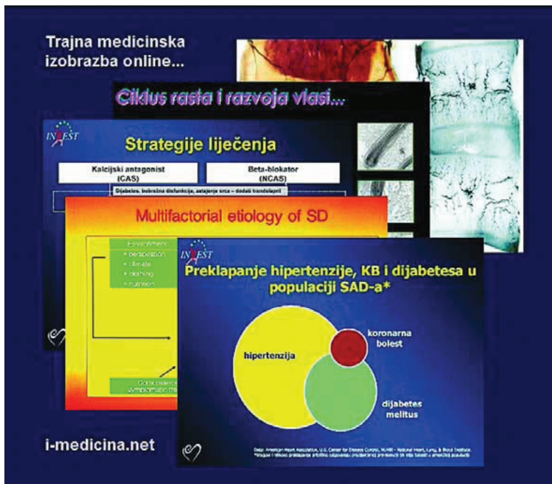
Slika 3. Presentacija sa stručnih sastanaka Trajnog simpozija HLZ-a – Podružnica Rijeka (dostupno online i na CDROM-u) Figure 3 Presentations from professional meetings of the Continuous Medical Education of HLZ (Croatian Medical Association) – Rijeka Branch (available online and on CDROM)