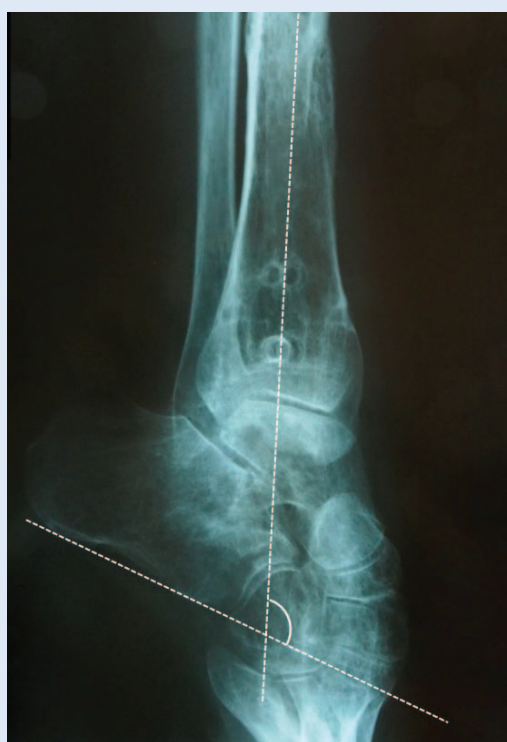
Slika 2b. Veličina equinusa mjerena je na postraničnoj RTG snimci gležnja, a predstavlja kut koji zatvaraju anatomsku osovina tibije i crta koja spaja najdistalniji dio tubera kalkaneusa i najdistalnije točke prednje artikularne površine. Navedeni kut prije operacije iznosio je 120°.

Rendgenološkom analizom izmjeren je varus gležnja od 40° i equinus od 120°. Utvrđene su i artrotske promjene gležnja III B stupnja po Takakuri (slika 2a,b).