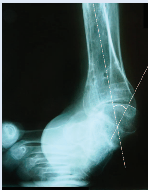
Slika 2a. Stupanj varusa stopala mjereno je na rendgenološkoj AP snimci, a predstavlja kut koji zatvaraju anatomsku osovina tibije i crta postavljena okomito na artikularnu površinu talusa. Varus kut iznosio je 40° (normalna vrijednost < 9°)