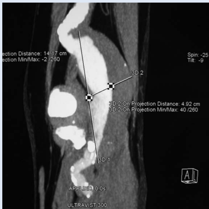
Slika 2. MSCT angiografija aneurizme poplitealne arterije

Najprikladniji transplantat zbog svoje prilagodljivosti i prohodnosti za postupak revaskularizacije jest autologna vena safena magna (slika 4). Postoji mogućnost korištenja i alternativnih vena kada je ona nedostupna, a u slučaju neodgovarajućeg autolognog transplantata moguće je korištenje politetrafluoroetilenske (PTFE) ili dakronske alogene proteze.