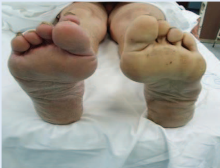
Slika 1. Akutna tromboembolija potkoljenice lijeve noge