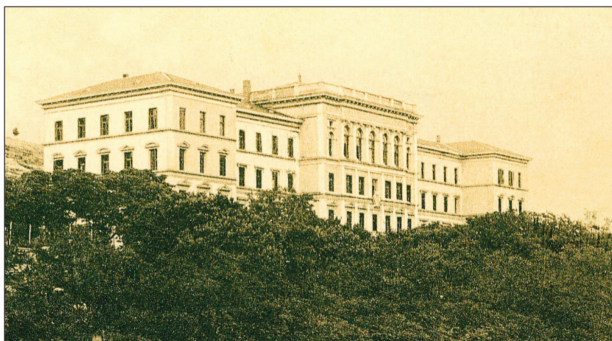
Slika 5. Zgrada nekadašnje Velike kraljevske gimnazije u Sušaku, u kojoj od 1978. do 1992. djeluje CUO kadrova u zdravstvu, a zatim Srednja medicinska škola.

Figure 5 Former Great Royal Grammar School building, accommodating an education centre for healthcare professionals and later the secondary medical school between 1978 and 1992