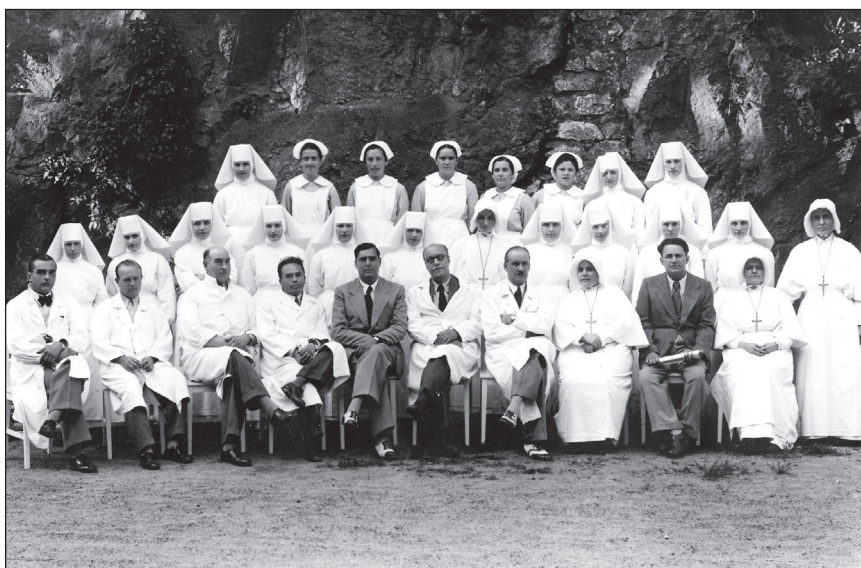
Slika 1. Prve diplomirane polaznice Bolničarske škole u Rijeci s nastavnicima i ispitnom komisijom 1939. Među njima je i 13 sestara milosrdnica.

Figure 1 The first generation of graduates of the Nursing School in Rijeka with teachers and examination committee in 1939. Thirteen of them are Sisters of Mercy.