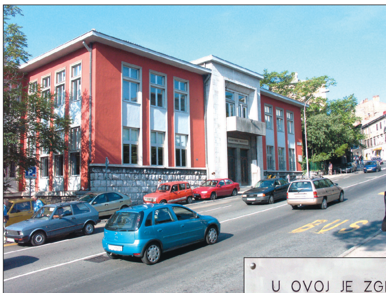
Slika 4. Dugogodišnja škola i internat za medicinske sestre u Ulici V. C. Emina. Danas zgrada Građevinskog fakulteta.

Figure 4 Former boarding school for nurses in the street of Viktor Car Emin. Now the building of the Faculty of Construction Engineering